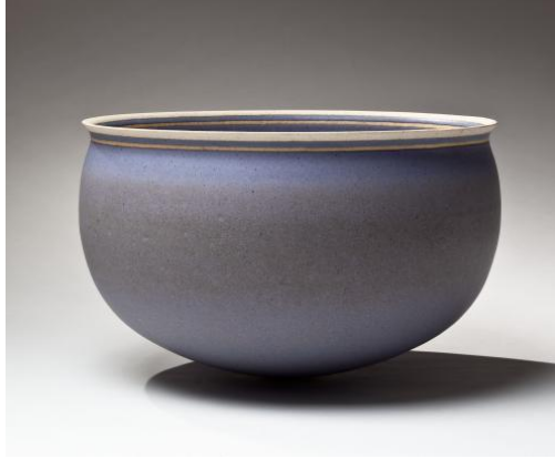
Şekil 7. Alev Ebüzziya Siesbye, 'Lilac Bowl', 1984, 28x18cm.

Bulutları izlemeyi seven ve yaşadıkları tüm boyutsal değişikliklere karşın hala bir bulut olduklarını belirten Jon Almeda, ilham aldığı bu durumu sanat hayatına yansıtmış ve bu alanda minyatür eserler üretmiştir. Formlarda yaptığı boyutsal değişikliklere rağmen izleyicinin onları hala seramik bir ürün olarak algıladığını ifade eden sanatçı, geleneksel seramikleri taklit ettiği minyatür eserlerinde işlevsel bir ürün algısı oluşturmaya karşın temelde pratik işlevi yok saymaktadır. Almeda, bulutlardan referans aldığı boyutsal farklılıklara karşın değişmeyen algı durumuyla yeni bir söylem geliştirmiş, temel dört yöntemden biri olan boyutsal değişiklik yöntemini de seramik formlarında bilinçli olarak kullanarak onları işlevsizleştirmiştir. Birçok zanaatkar ve sanatçı tarafından minyatür seramikler üretilmesine karşın sanatçının referans aldığı ve yeni bir söylem geliştirdiği bu özel durum onun eserlerini diğer minyatür eserlerden ayırmaktadır.