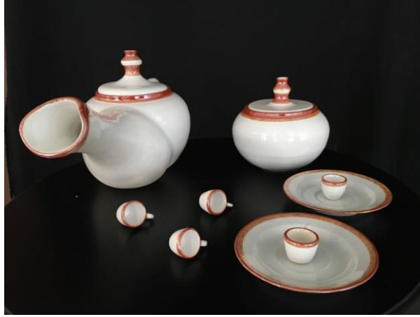
Şekil 10. Samet Aygün, 'Demlik', 2017, 61x52x18cm

yılında sergilediği sabah kahvaltısı adlı eserin yüzeyinde yaptığı küçük değişiklikler sonrası seramik çay setinde pratik işlevselliği yok saymıştır. Ayrıca eser için verdiği röportajda “dudakları” kullanarak insanlarda mecazi bir çağrışım yaratmak istedim” demiş ve eklemiştir: “Şüphesiz ki dudaklar iç dünyanın dış dünyaya açılan kapısıdır”. (URL-6, 2019) Bu sözlerden de anlaşılacağı üzere ihtiyaca yönelik üretilen geleneksel seramikleri referans alan fakat işlevsellik kaygısından uzak üretim yapan Baranga, kişisel söylemlerini eserleri vasıtasıyla aktarmaktadır.