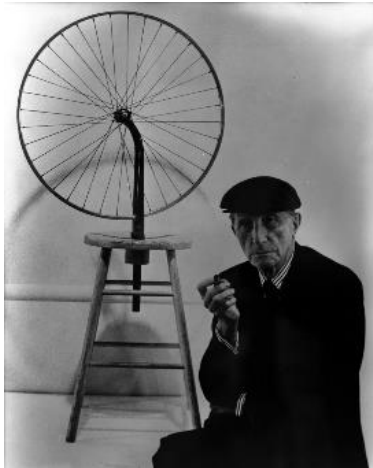
Şekil 2. Marcel Duchamp, 'Bisiklet Tekerleri', 1913.

Duchamp'ın her şey sanat eseri olabilir dediği süreçte Pablo Picasso ürettiği seramik eserler ile atölyelerde üretim yapan seramikçilere referans olmuş ve farklı bir sürecinde olduğunu göstermiştir. Bu süreçte Duchamp'ın her şey sanat eseri olabilir düşüncesine paralel Picasso'nun geliştirdiği herkes sanatçı olabilir düşüncesi, seramik sanatının gelişim sürecine katkı sağlamıştır.