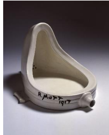
Şekil 3. Marcel Duchamp, 'Çeşme', 1917.