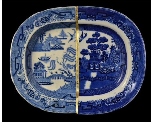
Şekil 4. Paul Scott, ‘Cumbrian Blue(s) Italian Willow’, 2014, 38x28cm.

Tarihsel süreçte yaşanan gelişmeler 21.yüzyılda beğeni kavramında hızlı bir değişime sebep olmuş, basit endüstriyel nesnelere talep azalmıştır. Bu durum sonrası seramik endüstrisi sanatçı ve tasarımcılarla birlikte çalışarak, tasarım gücü yüksek, günümüz estetik anlayışına uygun, estetik kaygılar barındıran işlevsel formlar üretmiştir. Disiplinler arası farklılıkların azaldığı, endüstri ve sanat arasındaki duvarların yıkıldığı bu dönemde sanatçılar yeni söylemler geliştirmiş, kullanıma yönelik üretilmiş endüstriyel ürünlerin barındırdığı işlevi kısmen veya tamamen yok sayarak eserlerinde kullanmışlardır. Makale konusu kapsamında işlevi bilinçli olarak sorgulayan ve bu bağlamda gündelik seramik nesnelere bir ifade aracı olarak kullanan, çağdaş seramik sanatçıların eserleri incelenmiştir.