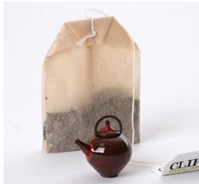
Şekil 6. Jon Almeda, ‘Small yet Sturdy’, 2017, 2,5x2,5cm.

Seramik Patchwork, kırık çanak çömleklerin dikiş tekniğiyle onarımı konusundaki bir düşünceden doğmuştur. Parçalarda çoğunlukla kumaşın yumuşak dokusunun hissedilmesine ve bir araya getirilmiş kumaş kaplı seramik parçaların hafif bükülmesine karşın insanların seramik bir nesne gördükleri deneyimlenir. (URL-4, 2019)