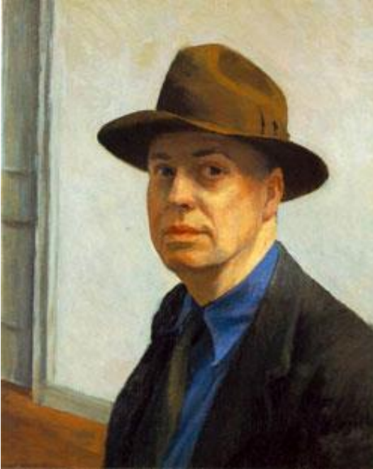
Görsel 4. Edward Hopper, 1930, Otoportre / Self-Portrait

Edward Hopper’ın Gece Kuşları / Nighthawks ve hemen hemen birçok eserindeki figürler, kompozisyondaki vazgeçilmez rollerini oluşturdukları duygu yoğunluklarıyla öne çıkmaktadır. Sessizlik ve durgunluk içinde öylece betimlenen figürlerin, mekânla iç içe bütünleşerek ayrı bir uyum inşa ettikleri söylenebilir. Mekânları, nefes almak ve yaşamak kavramlarıyla özdeşleştirilmiş ve yaşananların, yaşam alanlarının bütününe bir sahne olarak tasarlanmıştır. Mutlu ve rahat insanın giderek azaldığı günümüzde de insanların daha da rahatsız ve kaygılı bir hale geldiği gerçeğiyle birlikte düşündüğümüzde Hopper resimleri; bu dönemi bizzat yaşamış ve derinleştirmiş olmakla ayrıcalıklı bir yere sahiptir.