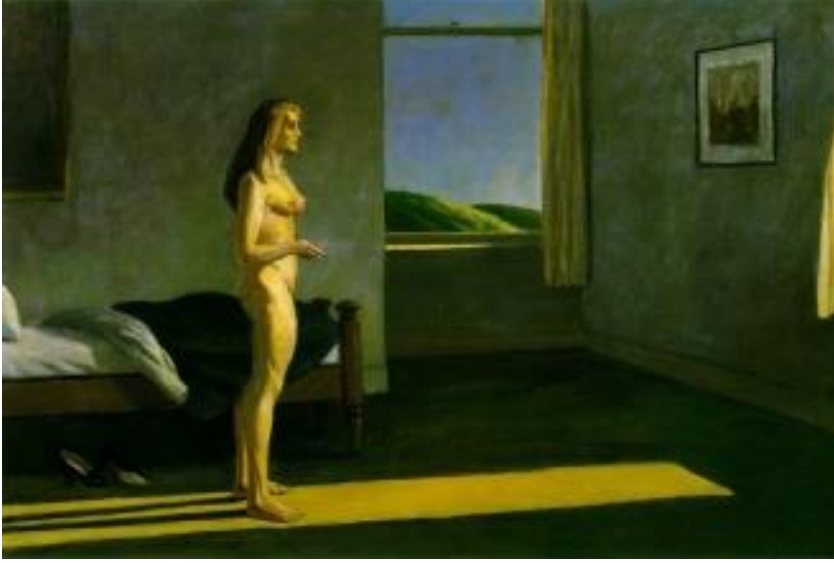
Görsel 3. Edward Hopper,1961, Güneşte Bir Kadın / A Woman in the Sun

Alışıl gelmiş yerleşik olan beğeniye karşı kendi sanat beğenisini ve kuralını oluşturmaktadır. Sanatçının nü tablolarındaki yalnız, kırılğan kadınlarında gizli erotizm, ışık ve mekân etkileriyle anlatımı güçlü kılmaktadır.