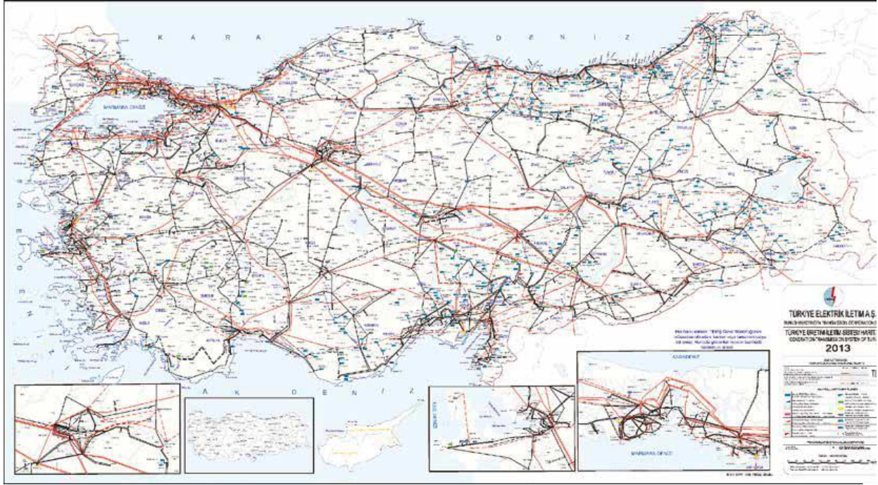
Harita 1. TEİAŞ Haritası ve Kapasite Projeksiyonu