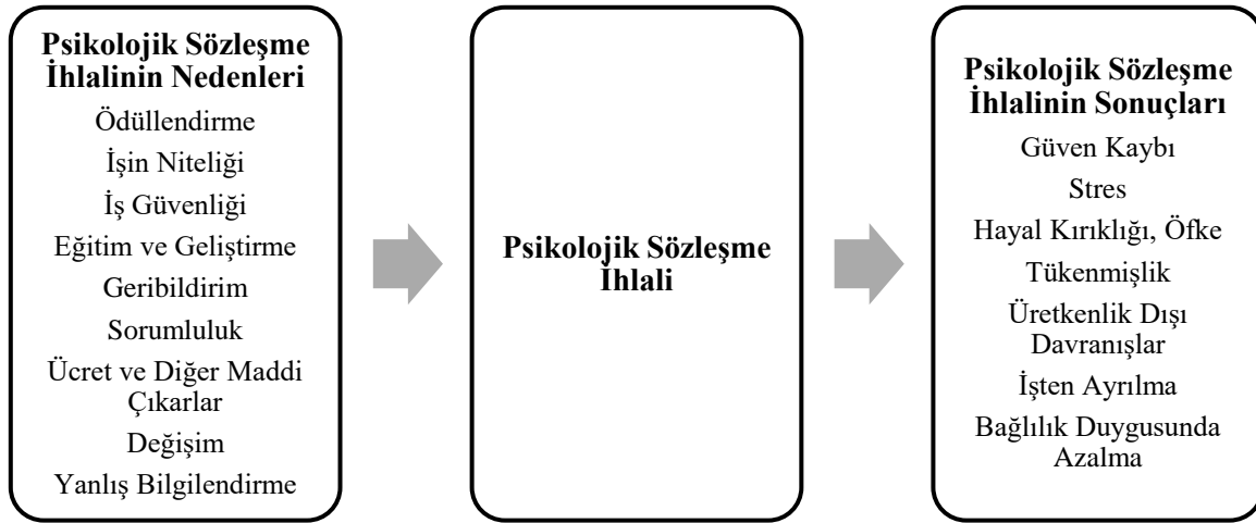
Şekil 1: Psikolojik Sözleşme İhlalinin Nedenleri ve Sonuçları (Seçkin, 2011:21)

Psikolojik sözleşmede karşılıklı taraflardan bir tanesinin, diğer tarafın sözleşmeye bağlı kalmadığına yönelik inancı psikolojik sözleşmenin ihlali yönünde bir algı geliştirmesi sonucunu ortaya koymaktadır. Özellikle de yapmış olduğu katkılar sonucunda işletmeden vaat edilenleri alamadığını düşünen çalışanlar, güçlü bir ihlal algısına sahip olmaktadır (Özdemir, 2013: 25).