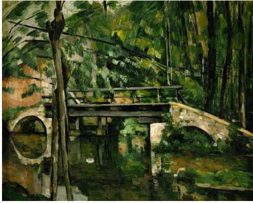
Görsel 1. Paul Cezanne Maincy'deki Köprü (Cezanne 1879)

Sanat, Cezanneyle birlikte beceriye dayanan bir uğraş alanı olmaktan çıkıp yavaş yavaş kavrama yöneliyordu. Eski sanatın yetkisine son vermiştir. Geçmişle hesaplaşmak onun getirilerini yıkmak ancak Cezanneye nasip olmuştu. Bir sanatsal bağımsızlığı ifade eden Cezanne, sanatını da ona göre dizayn eder. Cezanne, yeni bir sanatsal ruhun önde gelen temsilcisi olur. Böylece biçimde ve içerikte yeni bir sanatsal dilin en önemli temsilcisi haline gelir. Cezanne'nin önemi, farklı bir açıdan bakabilmeyi öğretmiş olmasıdır. Doğadaki nesnel realiteden uzaklaşarak sanatta yeni ufuklara yelken açacaktır. Cezanne, nesnelere içinden geldiğince yansıtır.