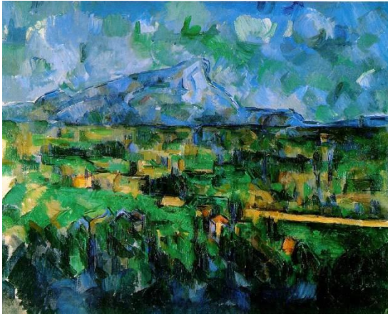
Görsel 4. Paul Cezanne, Sainte-vistoire Dağı (Cezanne 1902-1906)

Cezanne ,doğayı akılla yaşar. Biçim deformasyonları sayesinde düşlemsel sanata giden yolu açmış ve sanat, ussallık tarafından yönetilmeye başlamıştır. Doğanın mimetik olarak yansıtılması artık anlamını yitirmeye başlamıştır. Zihinsel ürünlere yavaş yavaş yönelen Cezanne, zihinsel formların doğadaki formlardan daha üstün olduğunu iddia ederek ruhunun özgür anlayışından beslenme yoluna gider. Doğanın incelenmesi ve yansıtılmasıyla ilgili bakış açısı, Cezanne için anlamını yitirmeye başlamıştır. Cezanne belki de sanattaki açmazlara bir çözüm getireceğini umut etmiştir. Yeni bir özne tasarımı gerçekleştiren Cezanne, sanattaki boşluğu gidermeye çalışmıştır. Sanatsal iklimi yeni değerler kazandırmış, yeni olanaklar yelpazesi oluşturmuştur. Geleneksel biçimlerin ve içeriğin kendisini ifade etmede yetersiz kalması nedeniyle formlardan taviz vermiş ve kendi biçim anlayışını geliştirmiştir. Böylece usandırıcı ve gittikçe kalıplaşan sanata karşı bir çözüm yolu bulmuştur.