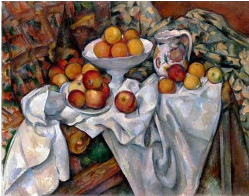
Görsel 3. Paul Cézanne, Elmalar ve Portakallar (Cezanne 1895-1900)

Cezanne’nin Naturalist anlayışından bir kaçışı olarak değerlendirilen çalışmaları ile yaratıcılığının hat safhaya ulaştığı söylenebilir. Dogmatikleşen sanat, Cezanne ile birlikte yıkılmıştır. Denetlenmez isteğin ulaştığı nokta, ilgi çekici hale gelmiştir. Cezanne’nin önemi, sanatı tekrar gözden geçirme ve sorgulama cesaretini kendinde bulmasıydı. Sanatdaki kalıpları ortadan kaldırmış, kısır döngülerin kırıldığı bir dönemde, biçimde büyük bir değişimi gerçekleştiren bir dönüşüme gitmiştir. Yaratıcı süreçte çoğu eleştirmenin, Cezanne’yi sanatta bir rahat kaçırıcı olarak görmesi, yaratıcı edininin, sanattaki etkisini göstermektedir. Cezanne’nin iç dünyasının bir somutlamasıyla sanata bir dinamizm kazandırdığı görülmektedir.