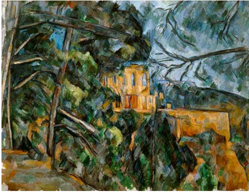
Görsel 5. Le Château Noir - Paul Cézanne (Cezanne 1904)