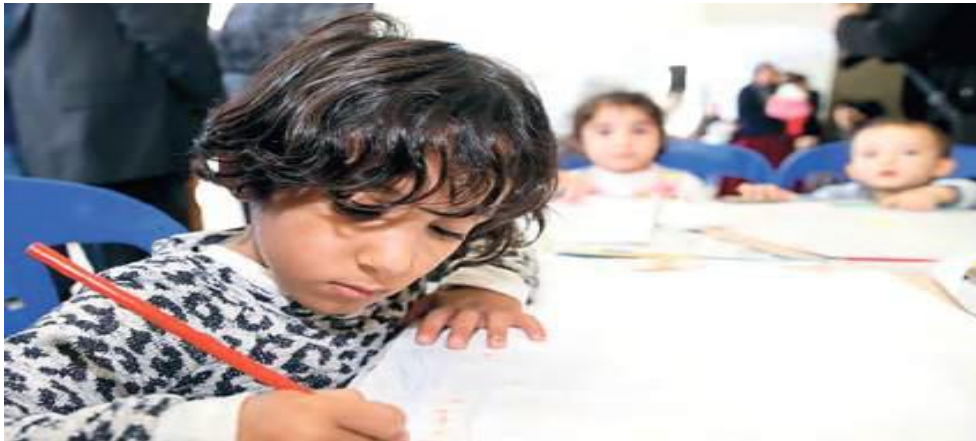
Görsel 1: Farklı Kültürler Bir Arada: “1 Tuval 1 Hayal Etkinliği”

İlkokul birinci sınıf ders kitabı incelendiğinde 6 üniteden oluştuğu görülmüştür. Kitabın, “Ülkemizde Hayat” başlıklı 5. Ünitesinde “Farklı Kültürler Bir Arada” başlıklı metin incelendiğinde, çok kültürlülük konusuna doğrudan odaklanılan tek metin olduğu dikkati çekmektedir. Metinde aşağıdaki görsele yer verilmiş ve “1 Tuval 1 Hayal” etkinliğiyle çocuklardan hayal kurmaları istendiği vurgulanmıştır. Çocuklara “görseldeki çocukların yerinde siz olsaydınız neler hissederdiniz? Söyleyiniz” şeklinde soru yöneltilerek empati kurmaları ve ona göre öğrencilerin düşüncelerini ifade etmeleri istenmiştir (MEB, 2019a: 148).