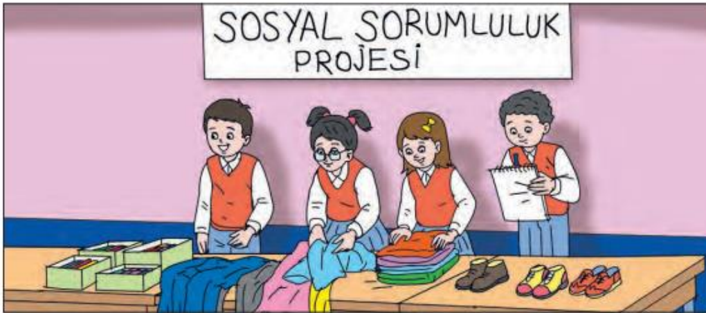
Görsel 3: Ülkemizde Farklı Kültürler “Sosyal Sorumluluk Projesi Etkinliği”

İlkokul üçüncü sınıf ders kitabı incelendiğinde 6 üniteden oluştuğu görülmektedir. “Ülkemizde Hayat” başlıklı 5. ünitesindeki 7. kazanım incelendiğinde “Ülkemizde Farklı Kültürler” başlığı altında çokkültürlü eğitime yer verildiği belirlenmiştir. Ders kitabında “Sosyal Sorumluluk Projesi” başlıklı etkinlikle çok kültürlülük konusuna yönelik farkındalık artırılmaya çalışılmıştır. İki sayfalık etkinlikte Ülkemizde, savaş gibi zorunlu nedenlerle veya iş durumu gibi isteğe bağlı nedenlerle ülkemize göç etmiş farklı kültürden insanların ihtiyaçlarını karşılamak amacıyla okulda yardım standı oluşturularak sosyal sorumluluk bilinci kazandırılmasının önemi vurgulanmıştır (MEB, 2019c: 142-145).