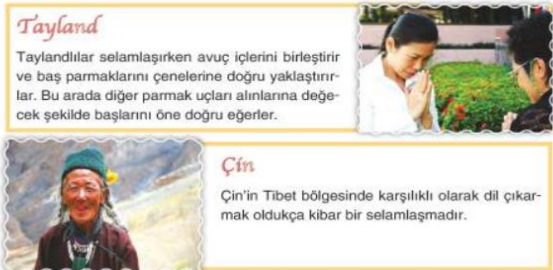
Görsel 6: Dünya Farklılıklarla Güzel: Selamlaşma