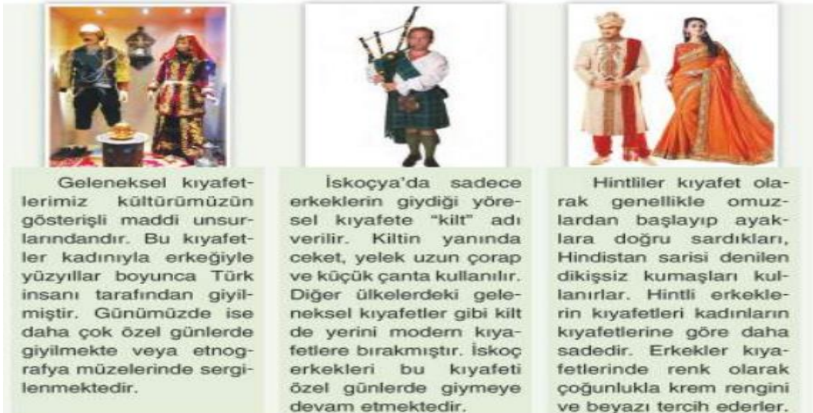
Görsel 5: Dünya Farklılıkları Güzel: Geleneksel Kıyafetler

İlkokul dördüncü sınıf Sosyal Bilgiler ders kitabı incelendiğinde 7 üniteden oluştuğu görülmektedir. Küresel Bağlantılar başlıklı 7. Ünite “Dünya Farklılıkları Güzel” başlığı altında nasıl ki bireylerin bir kimliği var ise ülkelerin de kendine özgü değerleri ve kültürel unsurları vardır denilmektedir. İnsanların kültürel özellikleri ülkelerin kültürel özelliklerini etkilemekte ve ülkelere özgü kimlikler oluşmaktadır. Bir ülkenin dili, bayrağı, dini inançları, bayramları, yemekleri, oyun ve dansları, düğün ve cenaze merasimleri ile başka ülkelere farklılaşmakta bu da kültürel bir zenginlik oluşturmaktadır (MEB, 2019d: 193). Aşağıdaki görsellerde farklı ülkelerin ve farklı kültürlerin geleneksel kıyafetlerine ve selamlaşma usullerine yer verilmiştir.