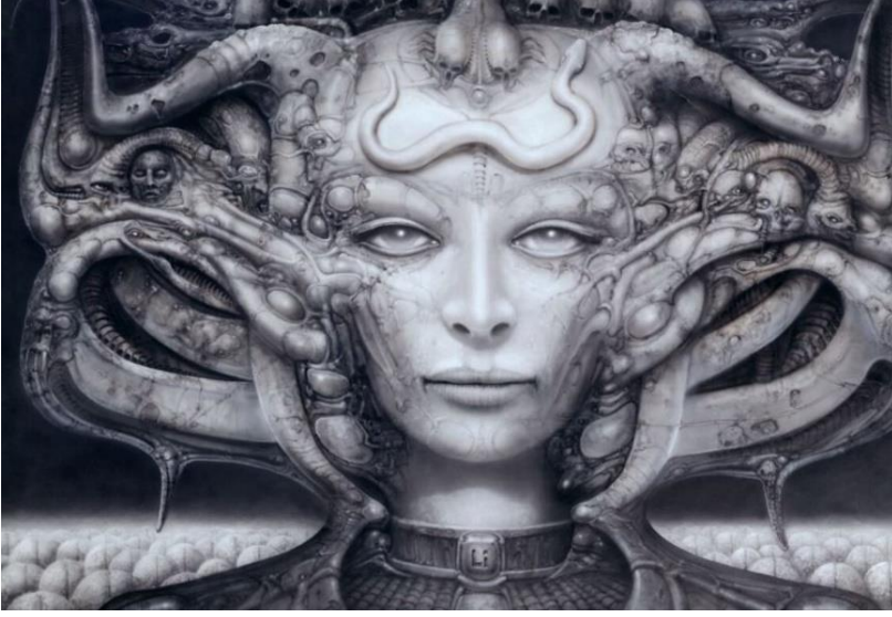
Resim-1: Hans Rudolf Giger, LI-I, Ağır kâğıt üzerine foto gravür, 100x70 cm, 1974.

Giger'in airbrush tekniğinin dışına çıkararak yaptığı ilk ve tek foto gravür örneğidir. Çalışma dokulu gravür kâğıdı üzerine yapılmış olup, 100x70 cm edatındadır.