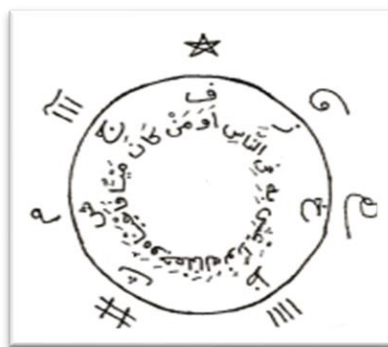
Ek-2: Saralı kişilere musallat olan cinlerin uzaklaştırılması için hazırlanmış bir Vefk-i Mühr-ü Süleyman 51