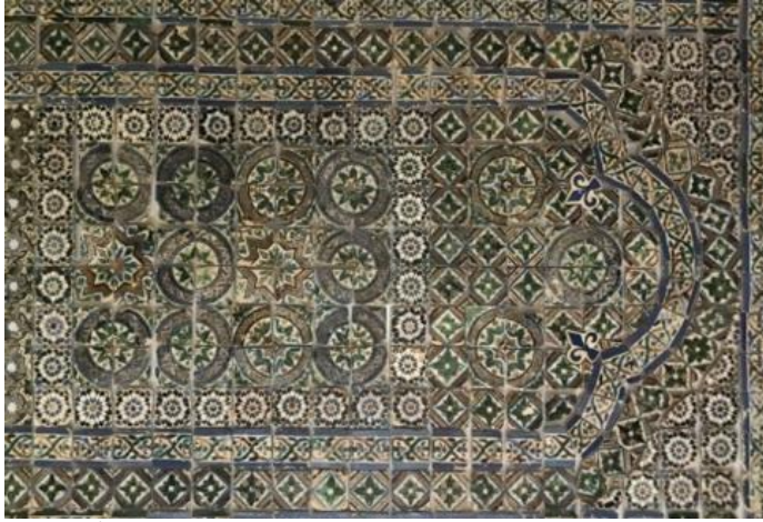
Şekil 8: İslam Motifli Azulejo, Seville, 1500-1550, Cuerda Seca ve Aresta Tekniği, Ulusal Azulejo Müzesi, Lizbon, Portekiz.

Azulejo uygulamalarında öne çıkan cuerda seca 2 ve aresta 3 tekniği 15. yüzyılda Sevilla'da (Şekil 8) geliştirildikten sonra Portekiz Kralı I. Manuel'in, Sevilla ve Saragossa'da Mağribi azulejolarını keşfetmesi ile Portekiz için mimari seramik alanında farklı bir dönem başlamıştır.