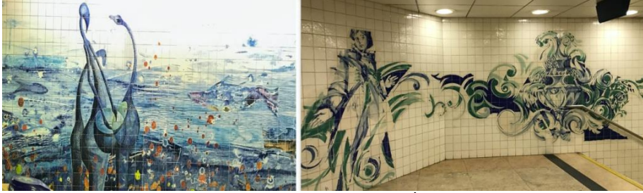
Şekil 35: Sanatçı Abdoulaye Konaté, Lizbon Oriente Metro İstasyonu, Lizbon, Portekiz.