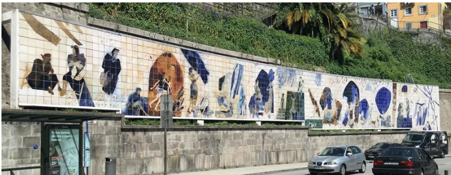
Şekil 21: Júlio Resende, 1987, Ribeira Tüneli, Porto, Portekiz.

1950'lerin kentsel gelişimi ve dönüşümü içinde azulejo tasarımında bir canlanma süreci başlamıştır. Mimarlar, Júlio Resende (Şekil 21), Júlio Pomar ve Sá Nogueira gibi genç sanatçıların eserleri ile birlikte yeni kentsel projeler ortaya koymuşlardır (Mitchell, 2017).