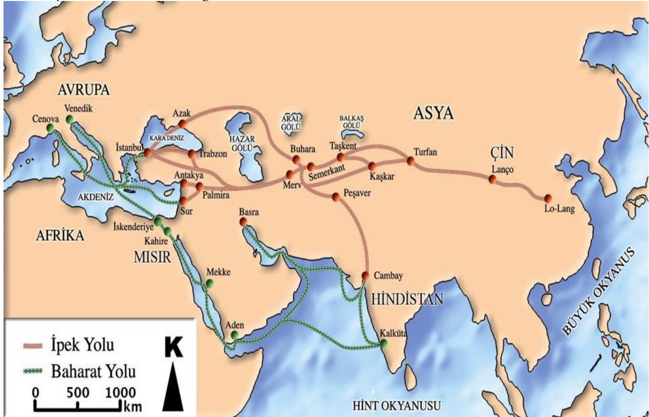
Tablo 2: İpek ve Baharat Yolu Güzergahı