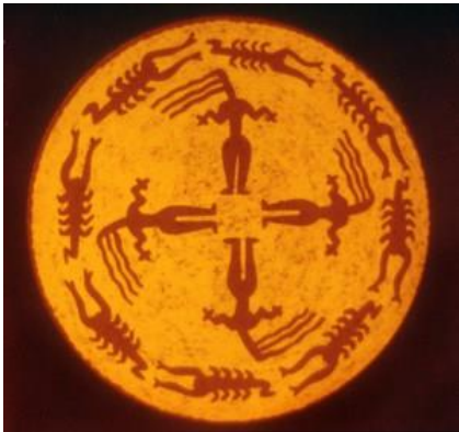
Görsel 3. Kadın ve Akrep Figürlü Boyanmış Tabak, Samarra MÖ 5000, Irak

Samarra çanakları, insan motifi olarak “dağınık saçlı kadın” bunlar içinde en bilinen örneklerdendir. Yanı sıra, akrep, balık, kuş, farklı boynuzlu hayvanlar ya da gamalı haç şeklindeki bezekler bir “anafor” oluşturacak şekilde genellikle çanakların dip kısımlarının iç yüzeyine boyanmaktadır. Söz konusu bezeklerin son derece doğal (natüralist) bir stilde yapıldıklarını vurgulamak gerekir. Çok zengin ve yoğun boya bezekler çoğunlukla “Näpfe” (çanak) ya da “Schüsseln” (tabak) formu kapların iç yüzeyini kaplamaktadır (Tekin, aktaran Durugönül, Durukan, Brands, vd. 2015: 50).