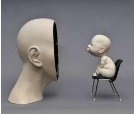
Görsel 10. Konuş Benimle, porselen, 40x20x29 cm., 2013