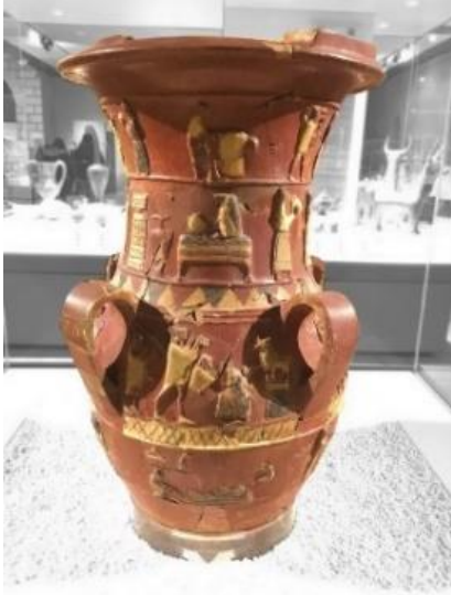
Görsel 2. İnandık Vazosu, İÖ 17. yüzyıl ortaları, Anadolu Medeniyetleri Müzesi, Ankara

Asya bölgesinde ilk hüküm sürmüş kültürlerden biri olarak bilinen M.Ö. XI. Binyıl Samarra seramiklerini incelediğimizde Kuzey Mezopotamya kültürü, Irak kültürü ile Anadolu kültürü arasındaki etkileşimde görülmektedir.