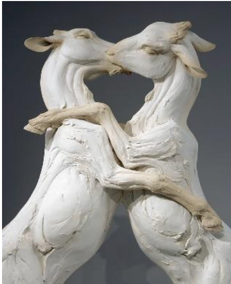
Görsel 11. Beyine Sıçrayan Kan, pekişmiş çini, sır altı boya, 2009

Amerikalı sanatçı Beth Cavener eserlerinde öyküleyici anlatımlarını metafor yaparak anlatmak istediği düşünceyi izleyiciye aktarmaya çalışır. Büyük boyutlu hayvan betimlemeleri, insan psikolojisine odaklanır ve insana özgü duygu ve davranışları içerir. Heykellerin bedenleri, korku, endişe, duygusal davranışlar gibi insanların hislerine ve düşüncelerine göre biçimlendirilmiştir. Sanatçı, figürlerini zaman zaman mekanların duvarlarına asarak izleyiciyi bir gerilim anına sürükler. Cavener'in heykelleri, biçim ve yüzey uyumunun mükemmel örnekleridir.