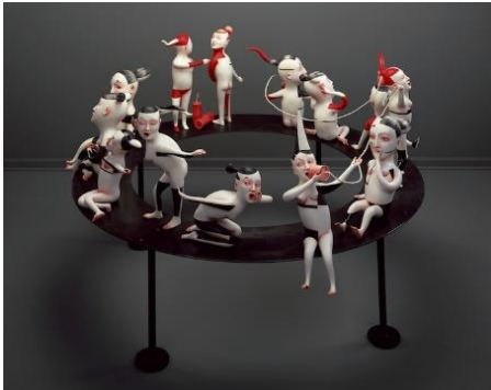
Görsel 9. Dedikoducu, seramik, sır altı ve sır üstü boya, metal, 25 x 84 x 84 cm., 2010

Seramik sanatçıları zaman zaman kendi hayat hikayelerinden yola çıkarak öyküleyici anlatım biçimini kullanmışlardır. Örneğin Amerikalı sanatçı Patti Warashina, günlük yaşamdan kesitler sunarak toplumu eleştiren ya da insanların toplum içindeki davranışlarını betimlediği eserler üretmiştir. Patti'nin "Dedikoducu" adlı çalışmasında insan figürleri yaptıkları işe odaklanmış ve dinamizm içeren bir şekilde; yüzleri, yaptıkları işle özdeşleşmiş ifade biçimleriyle betimlenmişlerdir. Sanatçı, bu figürler dizisinde, kadınların günlük yaşamlarına gönderme yapmaya çalıştığını ifade etmektedir.