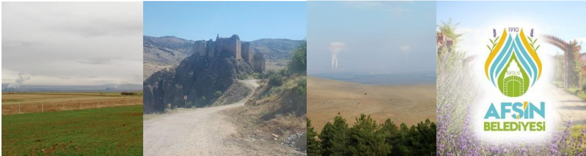
Fotoğraf 4. Tarım arazileri, Hurman Kalesi, Termik santral, Afşin Belediye logosu

Yazıbelen, Bütet mahallesi ile Arıtış ve Bakraç mahallelerinde 2016 yüzey araştırmaları yapılmıştır. Elde edilen seramik vb. buluntularla yörenin kültürel bağlantıları ortaya çıkartılmaya çalışılmıştır. Arıtış Mahallesi'nde MS V-VI. yüzyıla tarihlendiği sivil mimarilerde ve Erken Doğu Roma Dönemi kilise veya benzeri dini yapılarda da yer alan levha payeler taş eserler bulunmuştur (Dumankaya ve Ekmekçi, 2018). Tarihi İpek Yolu üzerinde Tanır Mahallesi batısında bulunan Kuruhan ve Suluk harabeleri ile Çoğulhan daki Çavlı Han, Halep-Kayseri ticaret yolu üzerinde kurulmuştur. Afşinbey İlkokulu bahçesi ile Afşin Fidanlığı arasında, Beyceğiz, Yeşilyurt mahallelerinde rastlanan mozaikler Roma dönemi ait mozaiklerdir. Afşin Belediyesi Sebhattin Atalay Kültür Merkezi bahçesinde oluşturulan açık hava arkeoloji parkında, ilçe genelinde bulunan tarihi eserler ile Roma ve Bizans döneminde ait yüzey kalıntıları sergilenmektedir. Kentin ilk yerleşim merkezi olan Kale'de yapılan araştırmalarda yine Bizans Dönemi'ne ait olduğu düşünülen 5-6 m uzunluğunda, 1,5 m yüksekliğinde bir sur kalıntısına rastlanmıştır. Burası sit alanı ilan edilmiştir (URL-8) (Fotoğraf 8).