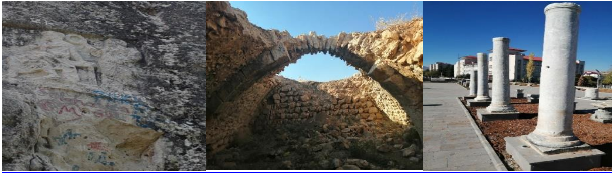
Fotoğraf 8. Kız-oğlan kayası (Kaşanlı Mahallesi), Kuruhan (Tanır mahallesi), Arkeopark (şehir merkezi)

Efsus Turan Mahallesi, Afşinbey Caddesi üzerinde 68.000 m 2 alana sahip yürüyüş ve bisiklet yolları, birçok bitki türü yanında sportif ve sosyal donatıların da bulunduğu Millet Bahçesi, rekreasyon anlamında önem taşımaktadır.