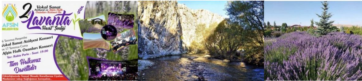
Fotoğraf 7. Lavanta hasat şenliği, Lavanta bahçesi ve Hurman çayı