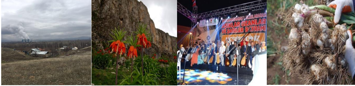
Fotoğraf 6.Hurman Mahallesinden Termik Santrali, Binboğa Dağlarında Ters Laleler, Aşık bayramı, Koçovası sarımsağı