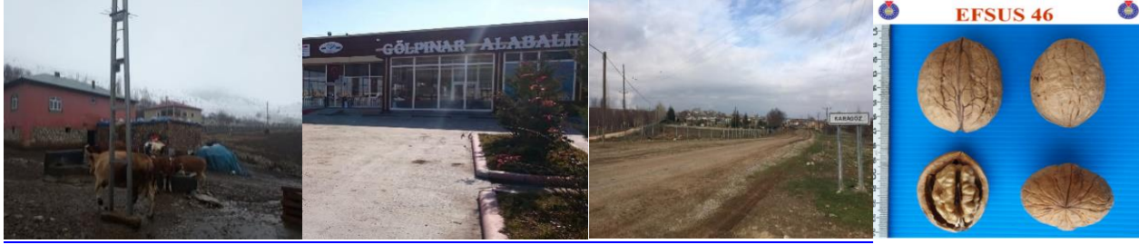
Fotoğraf 2. İnci Mahallesi, İncirli Mahallesi, Kabağağaç Mahallesi, Karagöz Mahallesi ve EFSUS Cevizi

Rotalar tematik ve ürüne dayalı olarak sürdürülebilirlik üzerine geliştirilebilir ve kırsal turizm rotaları oluşturulabilir. Kılıçsallayan (2021) çalışmasında yöredeki Tanır mahallesi, havuzlar, şelale, söğüt ağaçları arasından rekreasyon alanlarının bulunduğu Ayran dede, Hurman çayı, ağlayan gelin lalelerinin bulunduğu Binboğaların yüksek kesimleri üzerinden bir rotanın; Hurman kalesi, yine ters laleler ve kitabeler güzergahından diğer bir rotanın oluşturulabileceğini ifade edilmiştir. Ayrıca Maraş Doğa Platformu ve Kahramanmaraş Dağcılık Arama Kurtarma Kulübü (KADAK) ile Afşin'de doğa gezileri yapılmaktadır.