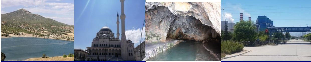
Fotoğraf.1 Tüllüce Tepe ve Esence Göleti, Eshabıkef Camii (Şehir Merkezi),Mağaragözü, Afşin-Elbistan Termik Santrali

rastlanmadığı sağlam zeminli, hava sirkülasyonunun olduğu 10 bin dönümlük alanda yapımına başlanan 1091 konutun kaba inşaatı tamamlanmıştır. Bu alanda 6 bin konutun yapılacak ve 150 bin kişilik yeni bir şehir kurulacaktır (URL-2).