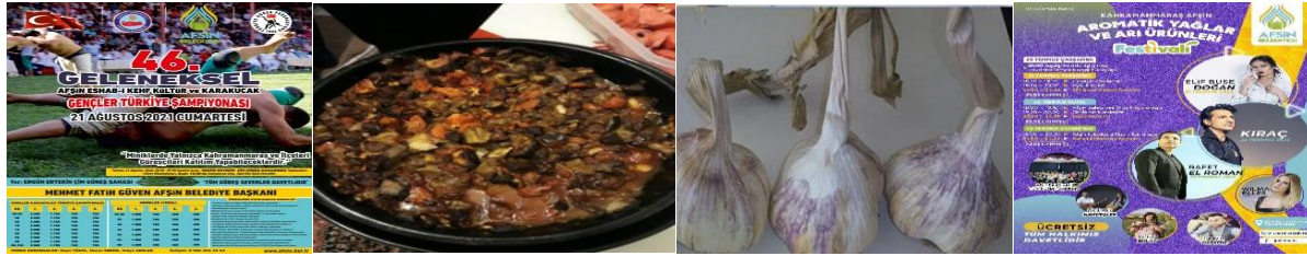
Fotoğraf 5: Karakucak Güreşleri, Afşin Tava, Koçovası Sarımsağı, Lavanta Festivali

Dünyada 2019' da başlayan Covid-19 pandemisi insanların yeme-içme alışkanlıklarında değişiklikler ortaya çıkarmış, sağlıklı ve organik beslenme giderek önem kazanmıştır, İnsanlar restoranlarda yemek yemeyi azaltmış ve bu da ev yemeklerine dönüşü sağlamıştır. Gıda güvenliği her zamankinden daha fazla önem taşımaya başlamış ve yöresel yemekler daha fazla ön plana çıkmıştır. Afşin'de Afşin tava, bulgur pilavı, yarma çorbası, kömbe pilavı, teş kömbesi, tarhana çorbası, hedik ve cıyıklama yöresel yemekleri özel lezzetler olarak sunulmaktadır (Fotoğraf 5). Ayrıca Afşin Türk kültür gelenek ve göreneklere ve akrabalık ilişkilerinin önem verildiği bir mekândır. Cumadan pazara süren davullu, zurnalı düğünler, kına geceleri, yemek hazırlıkları geleneksel olarak devam ettirilen kültürel miraslardır (Firikçi, 2002).