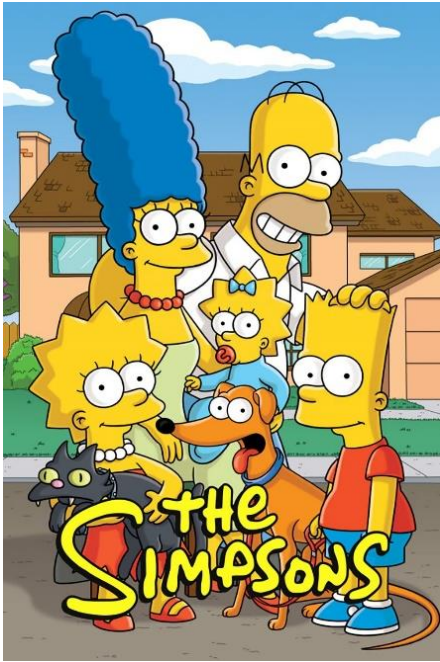
Şekil 2: Simpsonlar Ailesi