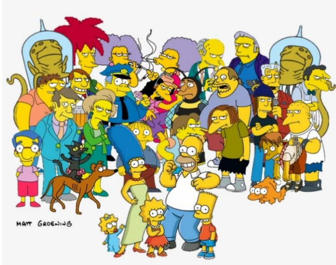
Şekil 3: Simpsonlar Karakterleri

Simpsonlar çizgi dizisi incelendiğinde; tıpkı Barthes'in, imgenin göstergesel gücüne dikkat çektiği gibi, bir Simpson karakterinin çizimi gibi bir imgenin, kendi içinde birçok geleneği barındırdığını söylemek mümkündür. İnsanlarla olan benzerliklerine karşın, Simpson ailesinin birçok üyesi, son derece biçimci çizimlerdir ve aslında insanın fiziksel yapısını andırmaktadır. Simpsonlar çizgi dizisinin metni tamamen bağımsız bir metindir. İçinde sonsuz sayıda gönderme ve bağıntı içerir. Bunların belli bir biçimde sınırlanmasına karşı çıkar. Metin incelendiğinde, içerdiği göstergeleri ön plana çıkardığı ve tahmin edilebilecek gösterilenleri karmaşık bir düzlem içerisine yerleştirerek, içeriği daha yüksek bir anlamlandırma süreci elde ettiği görülebilir.