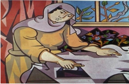
Görsel 11: Nurullah Berk, Ütü Yapan Kadın