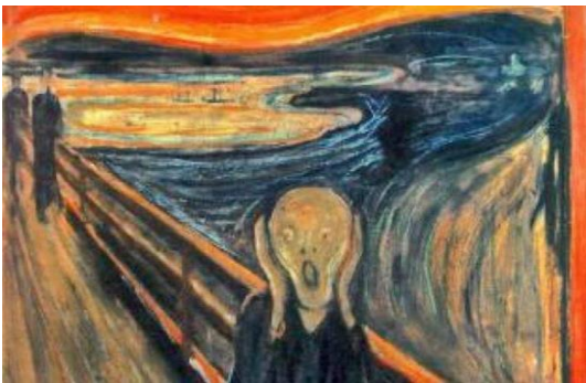
Resim 17: Edvard Munch, Çığlık, 1893