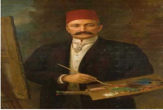
Resim 10: Şeker Ahmet Paşa, Otoportre