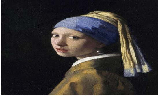
Resim 18: J. Vermeer, İnci Küpeli Kız, 1665

Öğrenciler canlandırdıkları tablolardaki figürlerin giysilerine uygun giyinerek ve makyajları yapılarak kendileri için sabitlenen bölmelerde kıpırdamadan tabloları canlandırmışlardır. Bu şekilde gerçekleştirilen canlı performans sergide öğrencilerde öğrenmenin kalıcılığının sağlanmak istenmesi vurgulanmıştır. (Resim 18, Fotoğraf ).