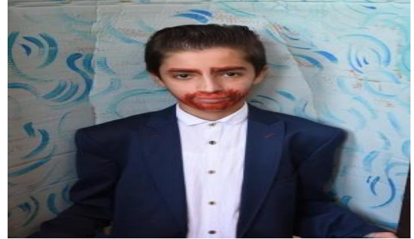
Resim 8'in Fotoğrafi: Van Gogh, Oto Portre, Canlandırma