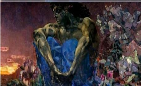
Resim 1: Mikhail Vrubel, İblis, 1890

Günümüzde Performans sanatlarında genellikle iki boyutlu yüzeyler üzerinde temsil edilen insan bedeni, artık başlı başına sergilenen sanatsal bir malzemeye dönüşmüştür (Antmen, 2009). Performans sanatı içinde bedenlerin kullanım alanı bulduğu bir çalışmada fotoğrafçı Andrew Kezzyn ile makyaj sanatçısı Bella Grigoryants'ın 2017 yılında aralarında Frida Kahlo, Andy Warhol, Picasso, Van Gogh gibi ünlü resamlara ait Portreleri sadece makyaj aracılığıyla yeniden canlandırılarak fotoğrafladığı çalışmalar yer almaktadır. (Resim 1-2, Fotoğraf).