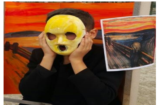
Resim 17'nin Fotoğrafi: Edvard Munch, Çığlık, Canlandırma