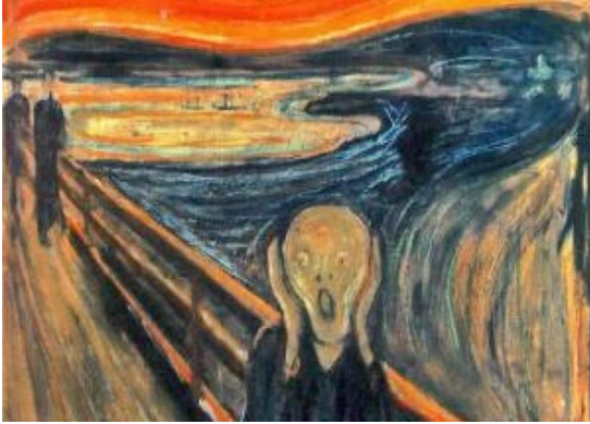
Resim 7: Edvard Munch, Çığlık, 1893

Yurt dışındaki bir sokak festivalinde gerçekleştirilen kostüm yürüyüşünden ilham alınarak derse uyarlanan bu performans dâhilinde, Vincent Van Gogh, Johannes Vermeer, William Adolphe Bouguerau, Pablo Picasso, Henri Matisse, Rene Magritte, Edgar Degas, Raffaello Sanzio, Oscar Kokoschka gibi farklı dönem ressamalarının resimleri yer alırken, Türk resamlardan da Mihri Müşfik, İbrahim Çallı, Nuri İyem, Osman Hamdi Bey, Hale Asaf gibi Türk resim tarihine damgasını vurmuş isimlerin resimleri de performansa dâhil edilmiştir. Müze eğitiminin görsel sanat eğitimi bağlamında ele alınışına farklı bir örnek sunan bu performansla, öğrencilerin yaparak yaşayarak, sürecin birebir içinde bulunarak öğrenme ve öğretme deneyimi yaşamaları ve gelecekteki mesleki yaşantılarında yenilikçi ve yaratıcı öğretmenler olabilmeleri için ışık tutması da amaçlanmıştır. https://www.haberturk.com/bursa-haberleri/65755780-yuruyen-ve-konusan-tablolar (Erişim Tarihi: 28.03.2020). (Resim 7, Fotoğraf)