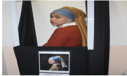
Resim 18'in Fotoğrafı: J. Vermeer, İnci Küpeli Kız, Canlandırma