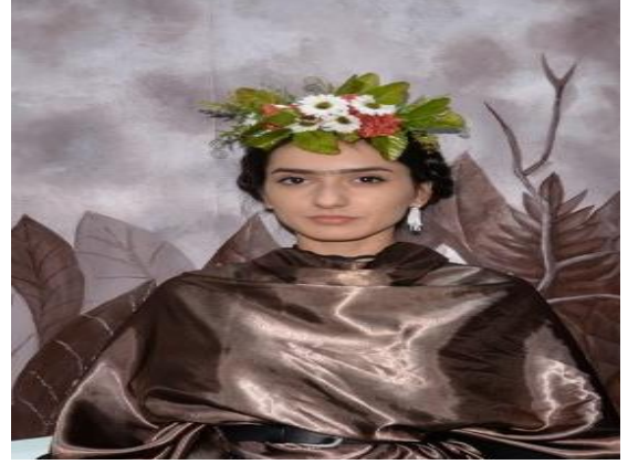
Resim 6'nın Fotoğrafi: Frida Kahlo, Otoportre

Yurt dışındaki bir sokak festivalinde gerçekleştirilen kostüm yürüyüşünden ilham alınarak derse uyarlanan bu performans dâhilinde, Vincent Van Gogh, Johannes Vermeer, William Adolphe Bouguerau, Pablo Picasso, Henri Matisse, Rene Magritte, Edgar Degas, Raffaello Sanzio, Oscar Kokoschka gibi farklı dönem ressamalarının resimleri yer alırken, Türk resamlardan da Mihri Müşfik, İbrahim Çallı, Nuri İyem, Osman Hamdi Bey, Hale Asaf gibi Türk resim tarihine damgasını vurmuş isimlerin resimleri de performansa dâhil edilmiştir. Müze eğitiminin görsel sanat eğitimi bağlamında ele alınışına farklı bir örnek sunan bu performansla, öğrencilerin yaparak yaşayarak, sürecin birebir içinde bulunarak öğrenme ve öğretme deneyimi yaşamaları ve gelecekteki mesleki yaşantılarında yenilikçi ve yaratıcı öğretmenler olabilmeleri için ışık tutması da amaçlanmıştır. https://www.haberturk.com/bursa-haberleri/65755780-yuruyen-ve-konusan-tablolar (Erişim Tarihi: 28.03.2020). (Resim 7, Fotoğraf)