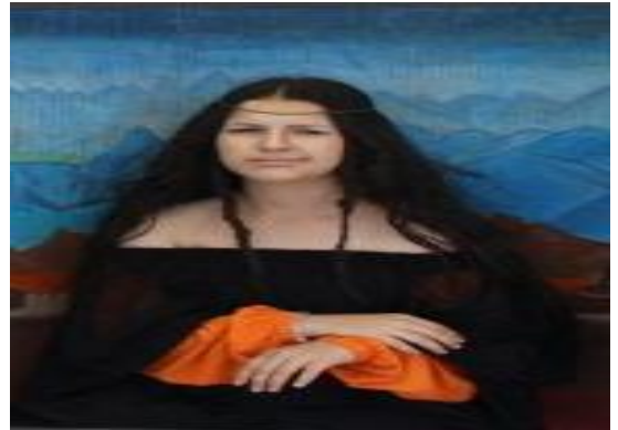
Resim 12'nin Fotoğrafi: Leonardo da Vinci, Mona Lisa, Canlandırma