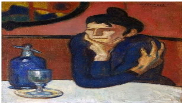
Resim 2: Pablo Picasso, Absent İçen, 1901