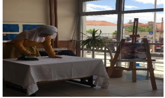
Resim 11'nin Fotoğrafi: Nurullah Berk, Ütü Yapan Kadın, Canlandırma

Yapılan bu canlı performanslarda tabloda bulunan eşyalara uygun eşyalarda canlı performansın içine katılarak sergilenmiştir. Öğrencilere uygun kıyafetler ile makyaj da yapılarak, tabloları ki figürlere benzetilerek canlı olarak sergilenme yapılmıştır. Sonra da sergilenen tablonun bir fotoğrafı Şövale üzerine yerleştirilmiştir. (Resim 12, Fotoğraf).