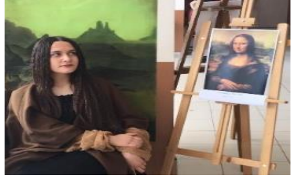
Resim 13'ün Fotoğrafi : Leonardo da Vinci, Mona Lisa, Canlandırma