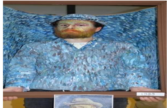
Resim 5'in Fotoğrafi: Van Gogh, Otoportre, Canlandırma

İzleyicilerin canlı performansın Müze Uygulamaları dersi kapsamında sergiyi ziyaret etmeden önce serginin etkinlik yönergesini okumaları da istenmektedir. Sergilenen bu canlı performans örneğiyle izleyicilere etkileşimli bir portre müzesi deneyimi yaşatılmak amaçlanmıştır. (Resim 6, Fotoğraf )