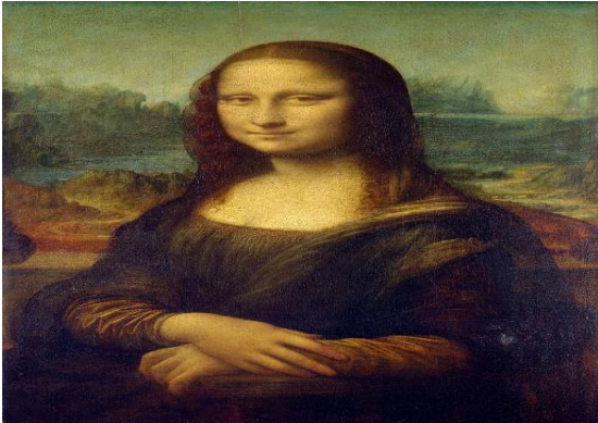
Resim 12: Leonardo da Vinci, Mona Lisa

Yapılan bu canlı performanslarda tabloda bulunan eşyalara uygun eşyalarda canlı performansın içine katılarak sergilenmiştir. Öğrencilere uygun kıyafetler ile makyaj da yapılarak, tabloları ki figürlere benzetilerek canlı olarak sergilenme yapılmıştır. Sonra da sergilenen tablonun bir fotoğrafı Şövale üzerine yerleştirilmiştir. (Resim 12, Fotoğraf).