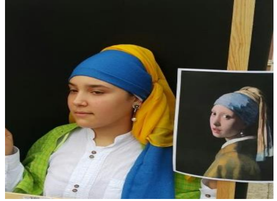
Resim 15'in Fotoğrafi: J. Vermeer, İnci K peli Kız, Canlandırma