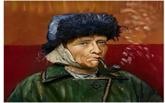
Resim 4'ün Fotoğrafi: Andrew Kezzyn, Van Gogh, Otoportre, Canlandırma