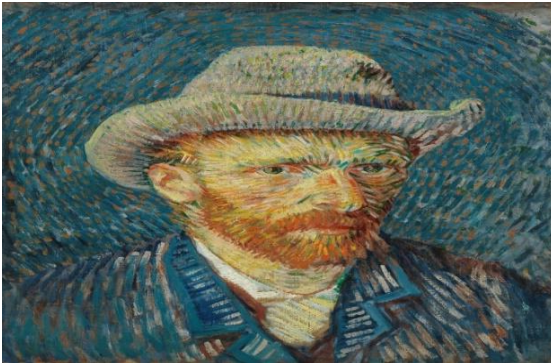
Resim 5: Van Gogh, Otoportre, 1887

Öğrenciler kendilerine benzerlikleri olduğunu düşündükleri tabloları ve ressamları hakkındaki bilgiler derleyerek, bu derledikleri bilgiler içinden bir kelimeyi de seçerek çerçevenin üzerine yapıştırmışlardır. Belirledikleri bu kelimeler, seyircilerin ressamlar ve tablolar hakkında konuşmalarını sağlayan şifreleri teşkil etmiştir. (Resim 5, Fotoğraf )