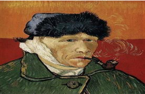
Resim 4: Van Gogh, Oto Portre, 1889