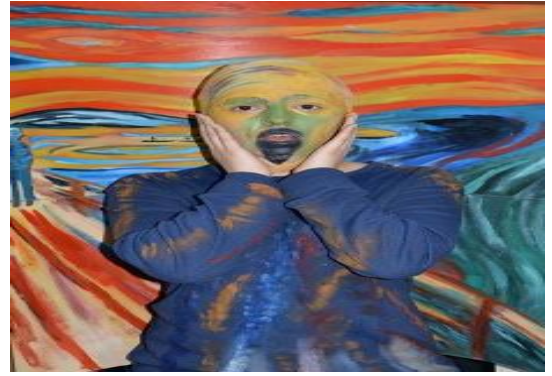
Resim 7'nin Fotoğrafi: Edvard Munch, Çığlık, Canlandırma