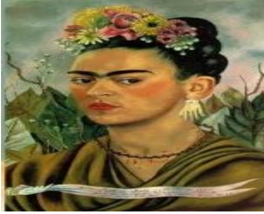
Resim 6: Frida Kahlo, Otoportre, 1940