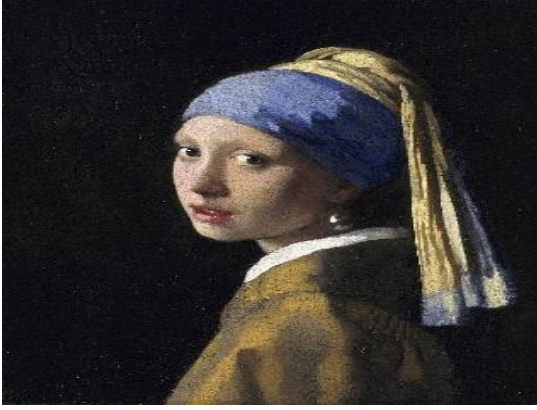
Resim 15: J. Vermeer, İnci K peli Kız