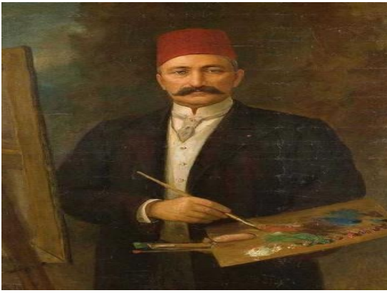
Resim 16: Şeker Ahmet Paşa, Otoportre