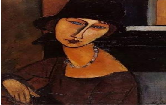
Resim 3: Modigliani, Jeanne, 1917

Bu çalışmalarda dünya sanat tarihine damga vurmuş, sanatçılara ait ünlü tablolar dikkate alınarak photoshop ve benzeri herhangi teknolojik bir program kullanılmadan sanatçıya ait esere sadık kalınarak, modele yapılan makyajla performans sergilenmeye çalışılmış ve bu performanslar da fotoğraflanmıştır. (Resim 3-4, Fotoğraf )