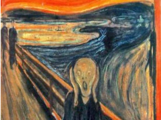
Resim 14: Edvard Munch, Çığlık

Şehit Polis Mehmet Çelik Ortaokulu görsel sanatlar öğretmeni Zuhale Ekinci, "Öğrencilerimle bu çalışmayı 4 ayda hazırladıklarını, sıfır atık projesine de destek vermek amacıyla bütün kıyafetlerin, çerçeveler ve arka planlardaki atıkları kullanarak çevreye de faydalı olduklarını söylemiştir. Ayrıca öğrencilerin seçilen 33 ressamı, çok iyi tanımlayarak başarılı bir çalışma gerçekleştirmişlerdir. https://www.haberler.com/izmirli-ortaokul-ogrencilerinden-canli-portreler-12083880-haberi/ (Erişim Tarihi:30.03.2020). (Resim 14, Fotoğraf )