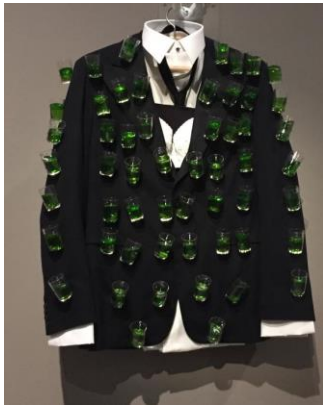
Görsel 10. Afrodisyak Ceket, Salvador Dali, 1936