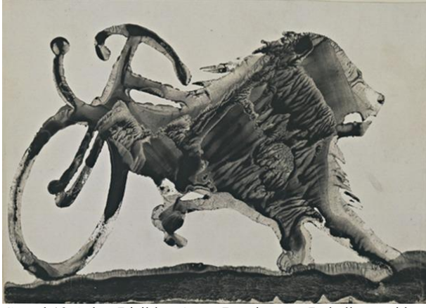
Görsel 13 Aslan-Bisiklet, Oscar Deminquez, Dekalkomani baskı tekniği Kağıt üzerine guaj boya, 1936