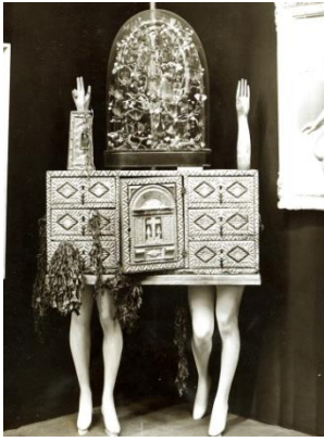
Görsel 8. Nesne Sandığı, André Breton,1938