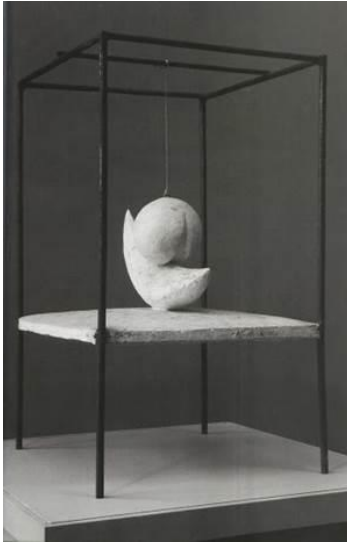
Görsel 6. Askıya Alınmış Top, Alberto Giacometti, 1931