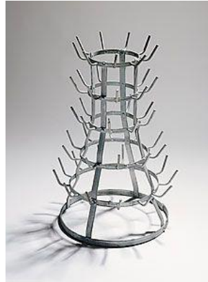
Görsel 11.Şişe Askılığı, Marcel Duchamp, 1914