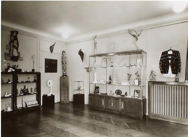
Görsel 7. Sürrealist Objeler Sergisi, Galeri Charles Ratton, Paris 1936