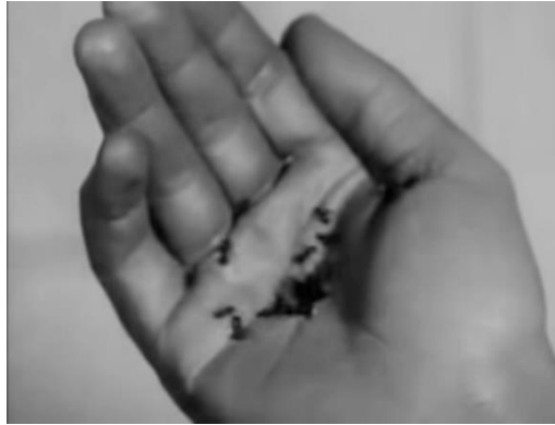
Görsel 2. Endülüs Köpeği, Salvador Dali, Louis Bunuél, 1928