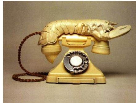
Görsel 4. Istakoz Telefon, Salvador Dali, 1936