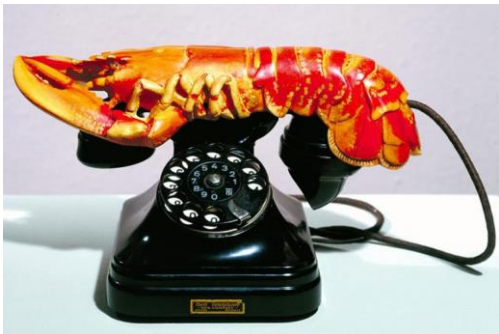
Görsel 3. Istakoz Telefon, Salvador Dali, 1936 Kaynak: http://masadergi.com/istakoz-telefon-salvador-dali/ Telephone 1.08.2021 15:32:56