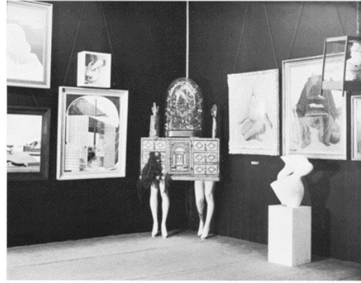
Görsel 9. Nesne Sandığı, André Breton,1938