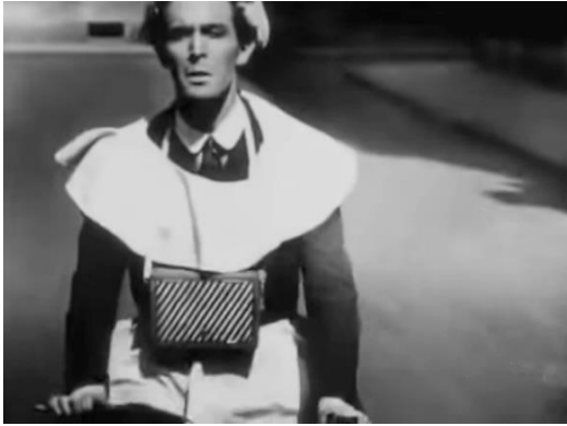
Görsel 1. Endülüs Köpeği, Salvador Dali, Louis Bunuél, 1928