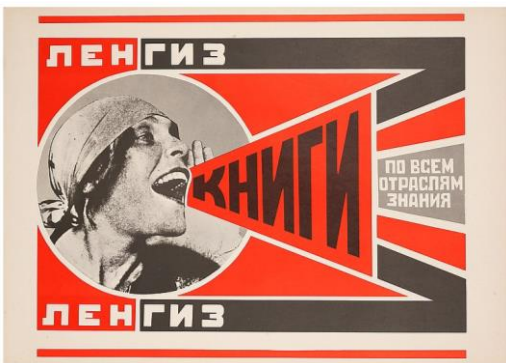
Görsel 3: Alexander Rodchenko, Afiş, 1924

Konstrüktivizmin temellerini atan bir sanatçı olarak tanınmasının yanı sıra iyi bir teorisyen de olan Alexander Rodchenko, Moskova'daki Sanat ve Kültür Enstitüsü'nde dönemin önde gelen yazar, yönetmen, tiyatrocu ve mimarlarıyla işbirliği yapmıştır (Uyanık, 2012: 143).