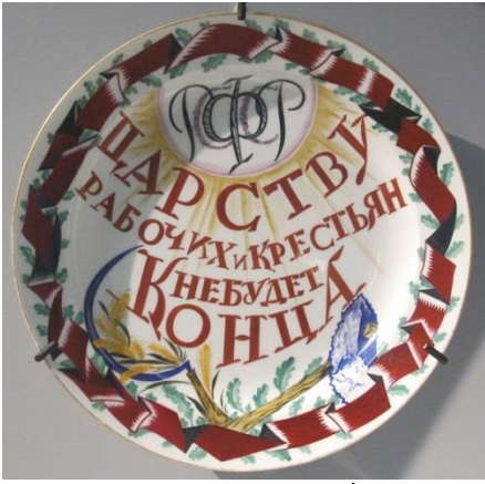
Görsel 5: Sergei V. Chekhonin 'İmza Tabacı'