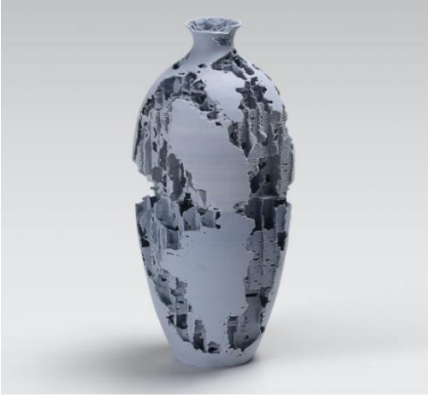
Görsel 20: Emre Can, '3 Boyut Baskılı Çömlek Mavisi', 2014