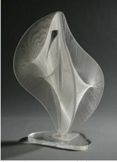
Görsel 2: Naum Gabo, Çizgisel Uzay Konstrüksiyonu No. 2, 1959-60

Konstrüktivizmin uygulayıcı ve öncülerinden kabul edilen, aynı zamanda kinetik sanatın kuramcılarında olan Naum Gabo 1915 yılında, boşluğun da sanat objesi olabileceği fikrini ortaya atmıştır. 1915 ve 1916 yıllarında ahşap, cam, metal, kontrplak, plastik gibi çeşitli malzemelerden yaptığı eserleri geometrik altyapı taşıdığı için zaman zaman kübik çalışmalar olarak değerlendirilmiştir. Halbuki Gabo'nun yapmak istediği, bir biçim oluşturmaktan ziyade iç yapıyı yani strüktürü göstermeye çalışmaktır (George, 1995: 25).