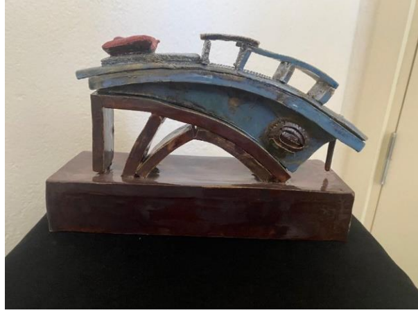
Görsel 24: M. Can Narman, "Konstrüktif Yapı" 34 cm x 38 cm x 7 cm