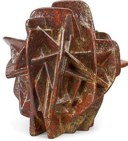
Görsel 10: Hans Hedberg, Kum Güllü Heykeli, 2000, Finlandiya

1917 İsveç doğumlu olan sanatçı Hans Hedberg genellikle yaptığı dev seramik meyveler ile tanınmaktadır. Ancak Görsel 10'da yer alan çalışmasında, çöllerde doğal bir taş olduğu bilinen kum gülünden esinlenmiştir. Eserde görülen geometrik yapıların konstrüktif yapıda olduğu gözlemlenmektedir. Eser pişmiş topraktan yapılmış ve 49.5 cm yüksekliğindedir (Hedberg, 2011).