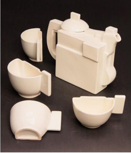
Görsel 9: Kazimir Malevich, Süprematist Fincan Takımı, 1923.

Malevich 'üstüncülük' diye Türkçeye çevrilen Süprematizm akımının öncüsü ve önemli temsilcilerindendir (Şenol, Asmaz, 2018: 829). Görsel 9'da görülen çay servis takımı da sanatçının Konstrüktif ve Süprematist yapıdaki çalışmalarına bir örnek teşkil etmektedir.