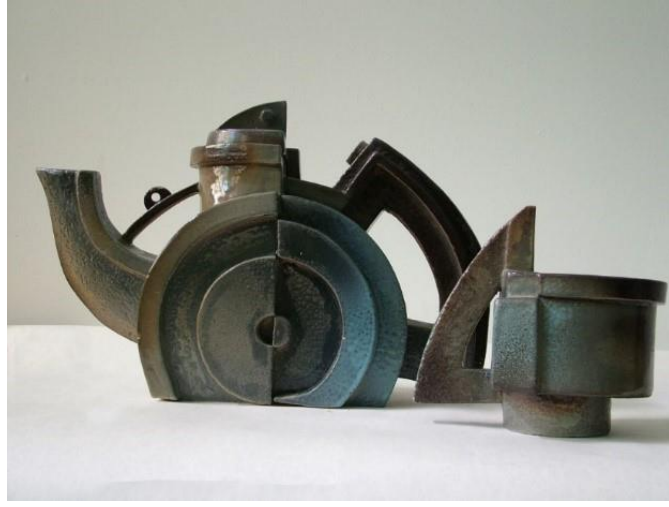
Görsel 14: Unknown, Konstrüktivizm Arşivleri, The Olive Press Gallery.

Eser sahibinin bilinmediği Görsel 14'de yer alan uygulamada bir demlik ve bir kupa konstrüktivist tavırla ele alınmıştır. Kazimir Malevich'in Süprematist Fincan Takımından da izler taşıyan çalışmada, Konstrüktif heykellerde sıklıkla görülen metalik etkiler dikkati çekmektedir. Eleman olarak kullanılan boşluk elementinin konstrüktif yapıda olduğunu göstermektedir (Constructivism,2010).