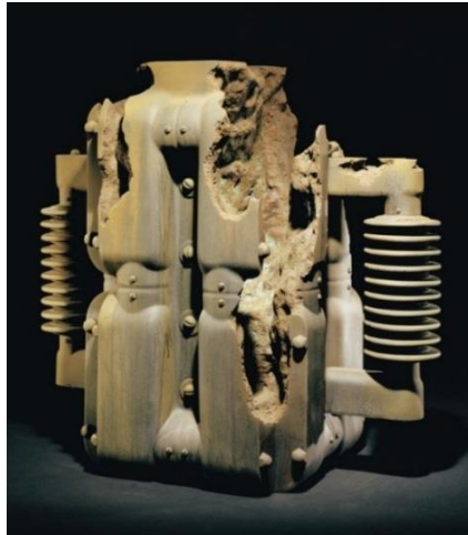
Görsel 16: Steven Montgomery, Boyalı Seramik Heykel, USA, 2011

Michigan, Detroit'te doğan sanatçı Steven Montgomery, lisans derecesini 1976'da Michigan, Allendale'deki Grand Valley Eyalet Üniversitesi'nden almış ve burada hem seramik hem de baskı resim üzerine yoğunlaşmıştır. 1978'de Philadelphia'daki Temple Üniversitesi Tyler Sanat Okulu'nda porselen mucidi Rudolph Staffel ile çalışmıştır. Eserlerinde görülen birim tekrarları ve eskimiş etkisi ile oluşturulan doğallık konstrüktivist eserlere gönderme yapmaktadır (Montgomery, 2010).