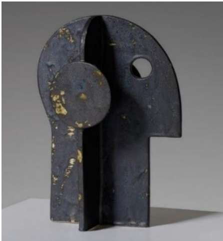
Görsel 11: Unknown, Konstrüktif Seramik Kafa Heykeli, 1960, Hollanda.

Kime ait olduğu bilinmeyen ancak 1960'larda Hollanda'da ortaya çıkan eserde (Görsel 11) konstrüktif yapı göze çarpmaktadır. Çamurdan şekillendirilen bu eserde boşluk bir eleman olarak kullanılmıştır. Ayrıca, aventurin sır kullanılarak ilk dönem konstrüktif heykellerinde görülen küflü metal etkisi dikkati çekmektedir. Özellikle Naum Gabo'nun kafa heykellerinden esinlendiği izlenimi veren bu çalışma, ilk dönem konstrüktif yapıdaki heykellere benzemektedir.