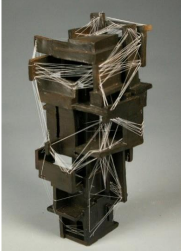
Görsel 13: Jeremy Stroup, Konstrüktivist Kule Kaynak: Stroup, 2011.

bir geometride forma asılması ve boşluğun bir eleman olarak değerlendirilmesi, eserin konstrüktif yapısını vurgulamaktadır. Seramik malzeme ile yapılan bu çalışmada plaka yöntemi tercih edilmiştir. Sanatçı, halen konstrüktif yapıya sahip eserler üretmeye devam etmektedir (Stroup, 2011).