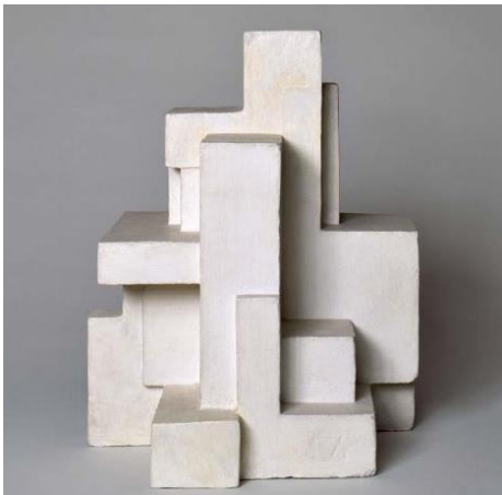
Görsel 7: Georges Vantongerloo, "Hacimlerin İlişkisi" 1919, Seramik, 225 x 137 x 137mm Kaynak: Vantongerloo, 1924.

Vantongerloo, De Stijl hareketi içerisinde özellikle heykel sanatına olan katkıları ve fikirliyle etkin bir isim olmuştur. 1916 yılında Doesburg ile tanışan Vantongerloo, bu etkileşim sonrasında soyut heykel çalışmalarına başlamıştır. Doesburg ile Mondrian, soyut sanatı felsefe ve mantıkla ilişkilendirirken, Vantongerloo ise sanat ve bilimin aynı yönde ilerlediğini ve eşit derecede yasalara sahip olduğunu savunmaktaydı (Esertaş, 2019:88).