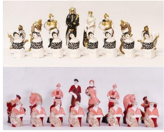
Görsel 6: Natalya Y. Danko, 'Kızıllar ve Beyazlar'

Görsel 5'de yer alan 1917 yapımı büyük tabağın ortasında Ekim Devrimi liderlerinin imzaları, bir orak ve çekiç; kenarlarında ise kırmızı kurdele ve yapraklar görülmektedir. Kızıl Ordu ve Beyaz Ordunun detaylı şekilde ele alındığı satranç takımı da Ulusal Porselen Fabrikası'nın propaganda amaçlı ürettiği seramik ürünlere güzel bir örnek teşkil etmektedir (Görsel 6).