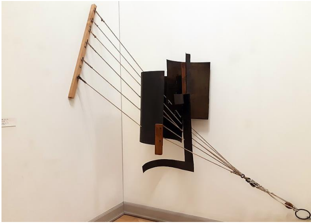
Görsel 1: V. Tatlin, “Corner Counter- Relief”, 1914

Tatlin’in yakın arkadaşlarından olan ünlü sanat tarihçisi Punin, Mart 1919’da yazdığı bir makalesinde III. Enternasyonal Anıtını şöyle tasvir ediyordu: “Tüm form çelik bir yılan gibi, tüm parçaların genel bir hareketi ile zeminde yükselmek üzere ölçülüp düzenlenir. Maddeyi yenmek için, yerçekimi kuvveti form ister; direncin gücü büyük ve ağırdır, kasları zorlayan form, dünyanın spirallerde bildiği en elastik ve koşu bandındaki gibi bir çıkış yolu arar.... Yerçekimi ve durgun suyun etkileşimi, statik durumun en saf (klasik) şeklidir; klasik dinamik formu bir sarmaldır. Sınıf çelişkileri toplumları toprağın mülkiyeti için savaştırdı, hareket çizgileri yatay; kurtarılmış insanlığın çizgileri ise sarmaldır. Spiral, kurtuluşun kusursuz ifadesidir; dünyayı ele geçirir ve gerçek hayatta da olduğu gibi, tüm hayvanların, dünyevi varlıkların ve sürüngenlerin çıkarlarından feragat edildiğinin bir işareti olur. Burjuva toplumları, hayvan dünyasında olduğu gibi, hayatı yer düzleminde kurdular; mağazalar, pasajlar, bankalar inşa ettiler. Burjuva hayatı kent meydanlarına odaklanır, seyre açık bir gösteridir, gösteriş için yaşanır. Hayvan dünyasında yaratıcı insanlık kaybolur, iş birliğinin ürünleri görülmez” (Punin, 1920: 311-312).