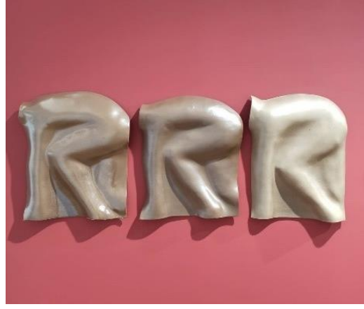
Görsel 21: Candeğer Furtun, 'Depar', 1988

Candeğer Furtun'un eserleri incelendiğinde Konstrüktivizm'in birim tekrarı kuralına uygun örnek verdiği gözlemlenmiştir. Candeğer Furtun, zengin form ve doku dünyasını yansıtan yüzden fazla yapıtını, atölyesindeki araştırma ve üretim süreçlerine yakından tanıklık eden arşiv malzemeleriyle bir araya getirmektedir.