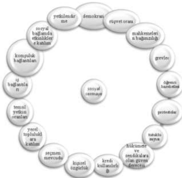
Şekil 1: Sosyal Sermayenin Bileşenleri (Yüksel, 2015; 33.)

İnsanların sahip olduğu ekonomik sermayeleri onların ne kadar mala sahip olmaları gerektiğini göstermektedir. Sosyal sermaye, diğer sermaye türlerinde olduğu gibi somut bir maddeye bağlı değer alan ve bu değeri kolaylıkla ölçülebilen bir kavram değildir. Yani birkaç değişkenle değerine ulaşılabilen bir ölçüye sahip değildir. Soyut bir kavram olması ve toplumdan, insanın toplumdaki yerinden, ilişkilerden, bağlantılardan, güven seviyelerinden, sosyal yakınlıklardan ve uzaklıklardan ve bunun gibi birçok kavramdan etkilendiği için ölçümünde çeşitli göstergelere ihtiyaç duyulmaktadır. Tablo 1'de Dünya Bankası'nın sosyal sermaye ölçümünde kullanılan göstergeleri gösterilmiştir. Buraya bakarak şunu rahatlıkla söyleyebiliriz ki sosyal sermaye göstergeleri maddi olarak değeri olan sermaye türlerinden farklı olarak sosyal, toplumsal, yasal ve hatta siyasal faktörlere dahi duyarlı bir şekilde gelişmektedir. Bu sebeple sosyal sermaye ölçümünde kullanılacak göstergeler dikkatli ve doğru ölçümü yapacak kıstaslara uygun bir şekilde seçilmelidir.