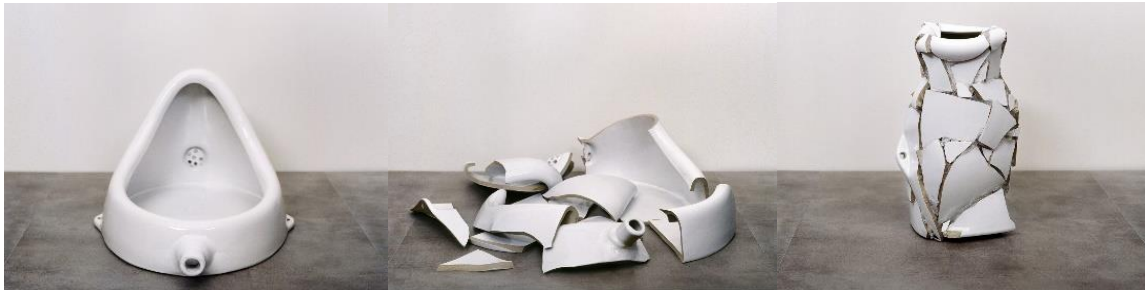
Resim 2. Zhou Wendou, “İsimsiz (Untitled)”, 2005.

Ancak Andre Breton’un da ifade ettiği gibi hazır bir nesne olsa bile ona sanat statüsü vermek, onun estetik duygu uyandırmasında kaçınılmaz olacaktır. Duchamp’ın bu tavrı sıradan bir nesneyi yüce bir konuma getirmek şeklinde okunabileceği gibi, karşıt bir anlamda düşünmek de olasıdır. Hazır bir nesne ya da zanaat ürünü sanat ile aynı statüye getirilmiştir. Yüksek ve alçak sanat, değerli ve değersiz arasındaki ayrım bulanıklaşmıştır. 4 Böylece sanatta değer kavramına ilişkin yeni ve farklı söylemler gelişmiştir. Çünkü bir sanat eserinin değerini; eserin plastik elemanları, zaman ve izleyicinin tepkisi belirler. Ancak hazır nesneyle oluşturulan eserde; eserin plastik etkisi devre dışı kalmıştır. Nesnede oluşturulan fikir ve düşünce ile birlikte izleyicinin katılımı ön plana gelir.