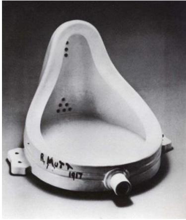
Resim 1. Marcel Duchamp, “Çeşme”, 1917.

Bu durum nesnenin görüntüsü ve algısı üzerinde değişimler yaratmıştır. Duchamp hazır nesneyi Çeşme isimli eseriyle sanat nesnesine dönüştürmesi; bir nesnenin görüntü ve algı arasındaki farklılığını ifade eder. “Andre Breton ve Paul Eluard tarafından 1938 yılında çıkartılan Dictionnaire Abrege du Surrealisme (Kısaltılmış Sürrealizm Sözlüğü) adlı sözlükte, Duchamp Hazır Nesne kavramını sanatçı tarafından sadece seçilerek sanat nesnesi sıfatına yükselmesini sıradan nesne olarak tanımlamaktadır.” 3