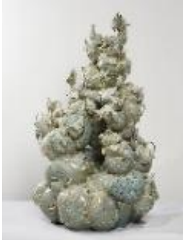
Resim 4. Yee Sookying, "Translated Vase" (Dönüşmüş Vazolar), 2012. Seramik Parçalar, Alüminyum Çubuklar, Epoksi ve 24K Altın, 157x88x93 cm.

Monument, İngiliz seramik endüstrisinin atıklarından oluşturulan bir enstalasyondur. Johnson Seramik Fabrikasından getirilen ve galeri alanına yerleştirilen kırık tabaklar, bardaklar, sürahiler ve diğer atık seramiklerin büyük yığından oluşur. Bu düzenleme ilk olarak Hollanda Zuiderzee Müzesinde mekâna özel bir sergileme şeklinde yer almış, ardından İngiltere MIMA'da (Middlesbrough Institute of Modern Art) sergilenmiştir. Twomey'in eserlerindeki kurgu malzemenin yaşam içerisindeki kullanımına yöneliktir. Diğer bir ifade ile gündelik yaşamda kullanılan her türlü araç ve gereçler onun için bir ifade şekline dönüşür. "Clare Twomey için kil, geçmiş yıllardaki toplulukların içme, depolama, taşıma ve değerli içerikleri paylaşma ritüelini yerine getirmelerini sağlayan "insan varoluşunun derinlerine gömülü" bir malzemedir. Bugün bu aşinalık seri üretime kadar uzanıyor: çoğumuz mutfak karoları, müze dükkânları bibloları ve hatıra kahve kupaları satın almış, dokunmuş veya kırmışızdır. O halde kil demokratik bir malzemedir, Twomey izleyicilerin onunla doğrudan karşılaşmasını sağlayarak mübadele, tüketim, hafıza, koruma ve arzu gibi sosyal ve kültürel süreçler üzerinde derin düşünmeyi teşvik eder" 10