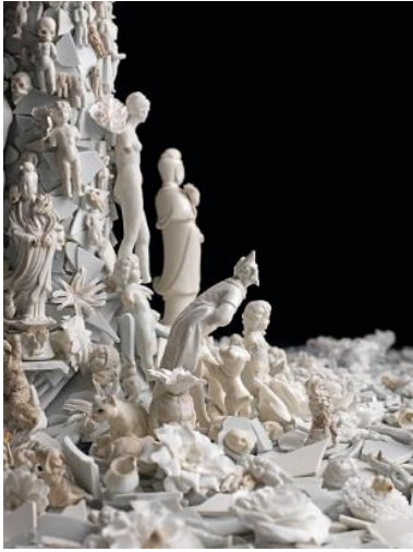
Resim 6. Bouke de Vries, "Son Akşam Yemeği", Detay