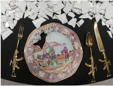
Resim 7. Bouke de Vries, "Son Akşam Yemeği", Detay II

2019 yılında İstanbul Meşher’de açılan Kalıpları Aşınca: Mit, Efsane ve Masallarla Avrupa’dan Çağdaş Seramik isimli sergide Bouke de Vries’in çalışmasına yer verilir. “Bouke de Vries başyapıtı “The Last Supper” (Son Akşam Yemeği)’da çatışmaya odaklanır. Bir mantar bulutunun etrafında binlerce parçalanmış porselen parçasından oluşan bir heykel görülür. Heykel bir merkez parçası olarak masanın ortasına kuruludur. Tabaklar ve sofr peçetelerinin arasında Deltware heyhelicikleri ile etrafı doldurulmuş bir düzenleme yapılmıştır.” 11 19.,20., ve 21.yy.’a ait porselen parçalarını bir araya getiren sanatçı, kırık porselen parçalarını onararak eski haline getirmek yerine yapıbozuma uğratar. Savaş sonrası yıkımı gözler önüne serer. Günümüz dünyasında silahlanma arzusuna, savaşa, yıkım ve ölüme işaret eder. “Yaşayanlar kaçınılmaz olarak ölmek zorundadır ve bu kısmen Bouke de Vries'in, eskimiş ve parçalanmış seramik kaplar ve heykelciklerden oluşan bir döküntü ile eklemlenen atomik bir patlamanın yüksek bir simgesi olan Son Akşam Yemeği’ndeki ifade gücünü ortaya koyar. Seramik, gerilim altındayken kırılmaya meyilli olan bir malzemedir. Bir seramik nesne kırıldığında, her parça yıkımın izleriyle sonsuza kadar çınlar. Parçaların kendileri artık var olmayan tek bir formu hatırlatır ve bu açıdan şiddet ve ölüme dair maddi anlatılar çağırıştırır. Son Akşam Yemeği, bu ilişkiyi, bir atomik mantar bulutunun temsili içinde kullanır ve yüksek teknolojinin insan amaçlarının en