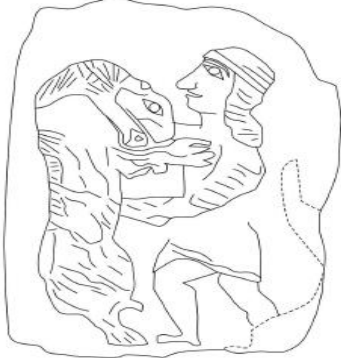
Şekil 16: Tell Halaf’dan Ortostat Kabartmasında Aslan Avı Sahnesi

Suriye’de sit alanı olarak bilinen Tell Halaf’da ortostat kabartmalarda aslan avı sahnelerine rastlanmıştır (Şekil 16, 17 ve 18). Tell Halaf kabartmalarda yardımcı eleman yoktur. Bu sahnelerde avcı figürleri atlı araba üstünde veya ayakta durur pozisyonadırlar. Avcılar mızrak, balta, hançer ve ok ekipmanlarla birlikte iki tekerlekli at arabalarını kullanmışlardır. Şekil 20’de arabaların üzerinde iki kişi vardır. Bunlardan biri dizgin ve kırbaç kullanarak taşıtın kontrolünü sağlayan sürücü olduğu ve diğerininse avcı olduğu görülmektedir. Resimler ister arabada isterse yerde tasvir edilsin avcılarının çoğunlukla önünde bulunan aslana doğru ok ya da mızrak atar vaziyette tasvirlerine rastlanır. Şekil 21’de ise Fenikelilerin etkisi olduğu düşünülen tasvir kanatlı olarak çizilmiş bir Tanrının Aslan öldürme sahnesi vardır. Bu sahneye göre konu Tanrılaşmıştır (Özüdoğru, 2013).