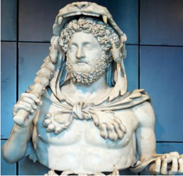
Şekil 26: Commedus ve lobotu