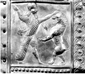
Şekil 6: Ziviye, Kabartma Bezeli Altın Levha İ.Ö. 7. yy. ilk yarısı