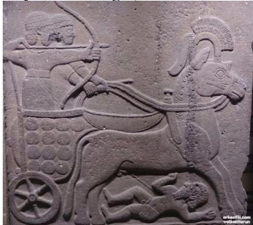
Şekil 15: Uzun Duvar Ortostati- Kargamış/Gaziantep ( M.Ö.1200-700)