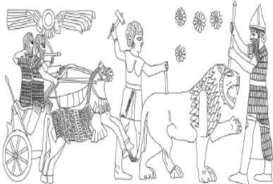
Şekil 12: Sakçagözünden Ortostat Kabartmasında Aslan Avı Sahnesi