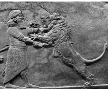
Şekil 5: Ninive, Asurbanipal (İsa'dan önce 668-627) Aslan Avı Sahnesi