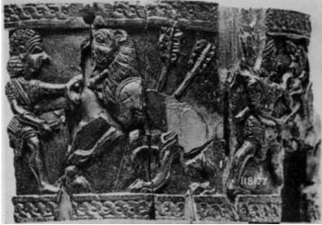
Şekil 21: Nimrud'dan Fildişi eser üzerinde Aslan Avı Sahnesi