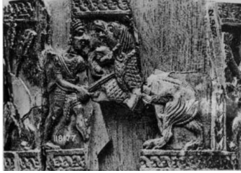
Şekil 20: Nimrud'dan Fildişi eser üzerinde Aslan Avı Sahnesi