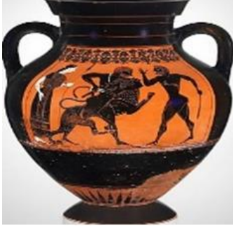
Şekil 23: Boyun Amphora, Milattan önce 515-510, Herkül, (Yunan) siyah figürlü pişmiş topraktan Nemean Aslanı ile güreş