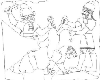
Şekil 11: Karkamış (Gaziantep) Ortostat Kabartmasında Aslan Avı Sahnesi