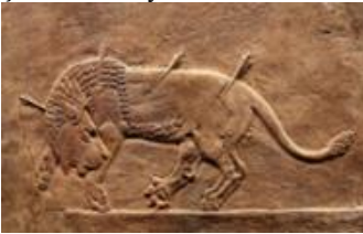
Şekil 8: Oklarla hırpalanmış Aslan, Milattan önce 645-635, Nineveh