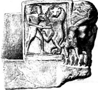
Şekil 14: Çıplak erkek figürü ile aslan mücadelesi