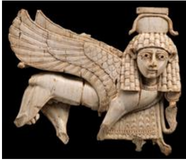
Şekil 28: Uzun adımlarla yürüten bir sfenks içeren tablet, Nimrud, Yeni-Asur dönemi, Güney Suriye tarzı, Milattan Önce 9. yüzyıl

Bazı görsellere bakılırsa Aslanlar krallar tarafından öldürülerek güç gösterisi için kullanılırken kadınların aslan bünyesine giydirilen resimleri ile onların güç sembolü, haline getirilmesinin örnekleri de görülebilir (Şekil 28, 29 ve 30). Demir Çağı boyunca büyük medeniyetler arasındaki karmaşık ticaret ağında yer alan kültürler ve tüccarların gemi enkazlarında ve yabancı yerleşim yerlerinde geride bıraktıkları izler vardır. New York Metropolitan Sanat Müzesi'ndeki bir serginin odak noktası, “Klasik Çağın Şafağında İberia'ya Asur” adlı gövdesi aslan başı kadın ve kanatları ile meleği andıran bir heykeldir (Şekil 31). Bu resimlerde aslan figürü ve melek beraber ifade edilmiştir. Aslan güç ve kuvveti ve melek kutsallığı ifade edebilir. Aslan taş kabartmaları, eski Hadatu kentinin kapılarını ve tapınak kenarlarını süsleyen insan ve hayvanların figürlerini içerir. Şekil 33'te Kabartmada Khimera olarak adlandırılan üç başlı sfenks tasvir ediliyor. Kuyruğunda yırtıcı bir kuşun başı olan tasvirde, kanatlı aslanın kafasının üzerinde sivri külahlı uzun örgülü saçlı insan başı vardır (Ürkmez, 2021).