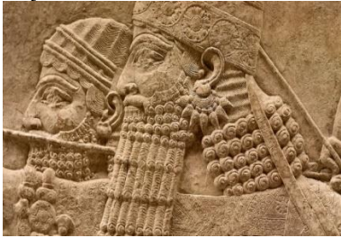
Şekil 33: Heykeltedeki küpe gösterimini gösteren bir relief tasvirini gösteren bir görüntü.