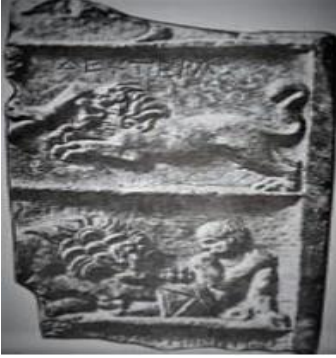
Şekil 25: Yeleli Afrika Aslanı, Ephesus Gladiators

ona misilleme olsun diye kendisiyle eşit olduklarını göstermeye çalışan Romalıların da bu yüzyıldan sonra ağırlıklı olarak aslanı kullanmalarına neden olabileceği gibi, hatta aslan yavrularının başlarından oluşan çarıkları ayaklarına giyerek ezeli düşmanları Mitridatis'e bir mesaj vermek istemiş olabilirler. Anadolu topraklarını ele geçiren Romalıların Anadolu'nun her bir köşesinde rastladıkları aslan figüründen etkilendikleri ve sonrasında da onların da aslanı öncelikle kullandıkları eşyaya kadar kendilerini bir güç timsali olarak göstermeye çalışmaları bu tarihlerden sonra olabilir. Anadolu topraklarını ele geçirdikten sonra özellikle Likya Kentlerinde Aspendos gibi, Olympos gibi antik kentlerin yağmalanması, Aspendos'taki tek bir heykel bırakmamacasına tüm heykellerin şehri yönetmek için atanan Roma valileri tarafından teknelere bindirilip Roma'daki saraylarına götürülmesi ve Anadolu'daki nice değerlerin günümüz yüzyılına gelene kadar yağmalanarak içinin boşaltılması gerçeklerini göz ardı ederek, bugün özellikle tüm Avrupa ve Amerika'daki müzelerde sergilenen eserleri Yunan ya da Romalılara ait eserler olduğu yanlışmacası altında bizlere zorla gösterilmeye çalışılan bir mercekle değerlendirip yorumlayamayız (Güneş, 2023).