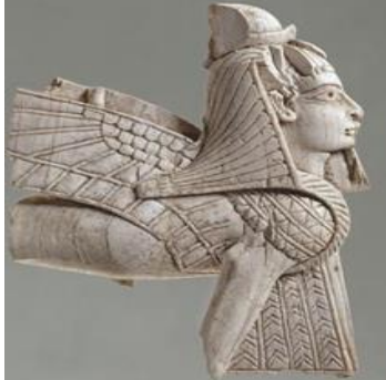
Şekil 29: Arslan Sfenks parçası (Başı kadın vücudu aslan olan bir heykel) – Milattan önce 8. yy.