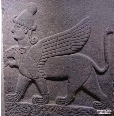
Şekil 30: Haberciler Duvarı Ortostatı- Kargamış/Gaziantep ( M.Ö.900-700)