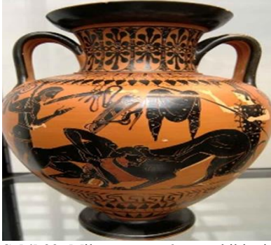
Şekil 22: Milattan önce 6. yüzyıl ikinci çeyreği; Yunan kültür ürünü

bir kişi görülmektedir. Bu kişinin Herakles olup olmadığı bilinmese de bu ikonografinin kahraman bir kralın aslanla mücadelesinin antik Yunanda da yaygın olduğunu gösterebilir (Ürkmez, 2021).