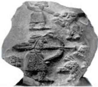
Şekil 1: Uruk, Bazalt Stel