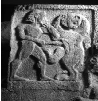
Şekil 13: Bey ve Aslan mücadelesi

Anadolu'da arkaik dönemde aslanlarla mücadelede yakın doğuş görülür. Örneğin Ksanthos Aslanlı dikmenin batı yüzünde doğrudan mezar sahibi bey ile ilgili konu tasvir edilmiştir (Şekil 13). Mezar anıtında çıplak ayakta duran bir erkek ile aslan mücadelesi Şekil 14'te görülmektedir. Mezar sahibi kılıcı aslanın karnına saplamıştır. Vücudu yandan, başı izleyicilere bakacak şekilde cepheden verilen aslan ise iki ayağını kendisini öldürenin dizine ve omzuna koyarak direnmeye çalışmaktadır. Bu resimler her ne kadar Kralların ve erkeklerin aslanları öldürmesinde korku hakim olsa da bazen yakın mücadeleye de girdiklerini ifade edebilirler. Şekil 15'te Uzun Duvar Ortostatında (Kargamış) Savaş arabasında bulunan iki kişiden biri atın dizginlerini tutarken, diğer kişi ise ok atar pozisyonda tasvir edilmiştir. Atın altında karnında ok saplanmış, çıplak ve sırtüstü yatan bir kişi vardır ( https://arkeofili.com/anadolu ).