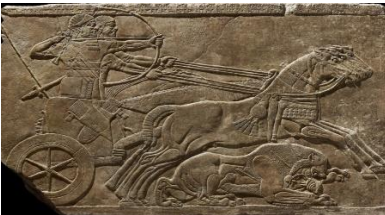
Şekil 7: Kraliyet Aslan Avı. Kalhu'daki II. Ashurnasirpal'in Kuzeybatı Sarayı'ndan, MÖ 875-860. Alçı (British Museum)