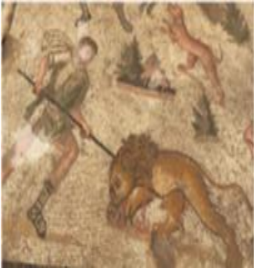
Şekil 27: Maraş mozaiklerinden aslan avı