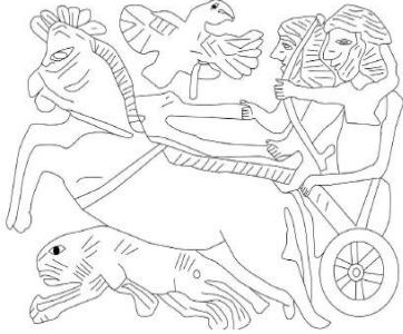
Şekil 17: Tell Halaf’dan Ortostat Kabartmasında Aslan Avı Sahnesi