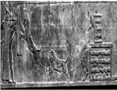
Şekil 4: Asur sarayı aslan avlama

Eski Asur'da aslan avı iktidardaki monarşinin halkı için mücadelesinin ve halkına karşı olan koruma güdüsünün simgeleşmiş halidir ( http://arkeofili.com/asur-krali ). Aslan ve boğa özellikle Asur sanatında, kralın bir spor olarak av sahnelerinde görülür (Şekil 4). Vahşi doğanın en güçlü avcısı, bir insan daha doğrusu kral tarafından öldürülmektedir. En çarpıcı ve canlı aslan avı sahneleri Geç Asur kralı Asurbanipal'in (İsa'dan önce 668-627) Ninive'deki sarayında tasvir edilmiştir (Şekil 5). Bu tasvirler tüm gerçekliği ve gerginliği simgeleyebilirler. Bunlardan birindeki kralın aslan öldürme sahnesi vardır (Şekil 6). Şekil 6'da Kral, daha önce okla vurulan yaralı aslanı bir eliyle başından tutmakta, diğer elindeki kısa kılıcı karnına saplamaktadır. Kompozisyon olarak en yakın örnek, Ziviye'den bir altın levha üzerindedir ve İsa'dan önce 7. yüzyılın ilk yarısı içinde tarihlenmiştir. Burada kral ayağa kalkmış aslanı basından tutmuş ve havaya kaldırdığı kılıcını saplamak üzeredir. Asur örneklerinden anlaşıldığı üzere; aslan avı bir soylu spordur. Avda aslan öldürmesi gücün ve kahramanlığın simgesidir. Ziviye örneğiyle bunun "tanrısal gücü" simgelediği anlaşılır. Kral, ava yanında yardımcıları veya askerleri ile katılsa da, son hamlede aslanı sadece kral öldürmektedir. Ziviye örneğinde olduğu gibi, konu "tanrısal" olunca, başka bir figür kullanılmadan kendi gücüyle öldürmesi doğaldır (Özüdoğru,2008; Özüdoğru, 2013).