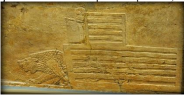
Şekil 9: Mezopotamya, Irak. Milattan önce yaklaşık 645-535, Kuzey Sarayının C odasından, Nineveh (günümüz Kouyunjik, Musul Valiliği), İngiliz Müzesi, Londra