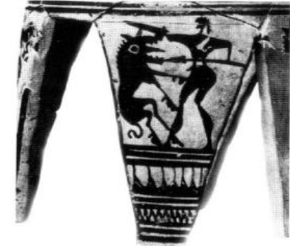
Şekil 24: Kılıç ve Mızrakla Aslan Öldürme Sahnesi