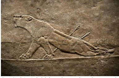
Şekil 31: Dişi bir aslan pek çok yara aldıktan sonra ölümlerini gösteren bir relief tasviri. Kaynak: British Museum Asur Arkeolojisi Sergisi No: 124856

Aslan Avı, antik çağın en büyüleyici sanat eserlerinden biridir. Acı çeken aslanlar, cesur ve meydan okuyan olarak tasvir edilir, ancak sonunda oklar, mızraklar ve kılıçlarla yenilirler ve bireysel olarak acı çekerek ve ıstırap içinde ölümlerini gösterirler ( https://joyofmuseums.com/museums/united-kingdom ). İngiltere'de müzede aslanların avlanması ve ok almış değişik şekilleri mevcuttur (Şekil 31 ve 32). Yaralanmış aslanlar ve okların duruş şekilleri acımasız bir mücadelenin olduğunu ifade edebilir.