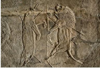
Şekil 32: Yaralanmış olan iki aslanın bir relief tasvirini gösteren bir görüntü.