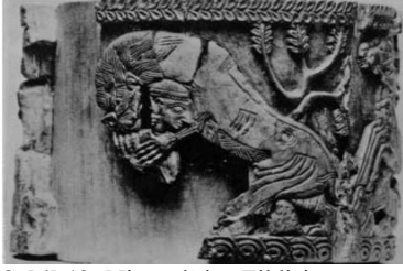
Şekil 19: Nimrud'dan Fildişi eser üzerinde Aslan Avı Sahnesi