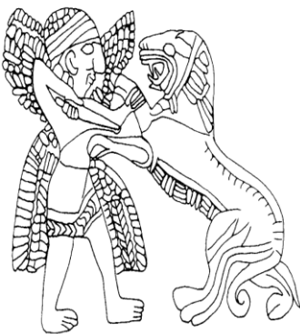
Şekil 18: Tell Halaf kabartması, Aslan öldüren Kanatlı Tanrı