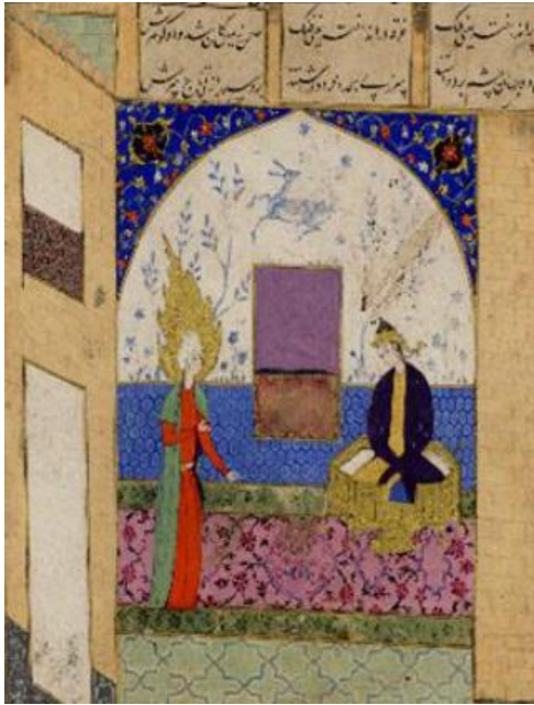
Resim 5 Hz. Yusuf ile Züleyha'nın karşılaşması, Mahzenü'l-Esrâr, Kayıt no:1941,0619,0.10 (Http-4)

Kervancılar tarafından kuyudan çıkartılarak Mısır'da köle pazarında satılan Hz. Yusuf'un Mısır Azizi tarafından satın alındığı belirtilir. "Azizin Züleyha adında genç bir karısının olduğunu ifade eden yayınlarda, bu genç kadının kendisine köle olarak alınan Yusuf peygambere âşık olduğu söylenir(And, 2012, s. 436). " Hz. Yusuf ile Züleyha'nın karşılaşmalarını konu edinen Mahzenü'l-Esrâr yazmasındaki (resim 5) minyatür British Museum'de (1941,0619,0.10) numarasıyla kayıtlıdır. Bu minyatürde olay iç mekânda cereyan eder ve duvarlar farklı motiflerle bezelidir. Arka fonda hareketli bir ceylan figürü ve çeşitli ağaç motifleri görülür. Züleyha sarı ve lacivert bir elbiseyle altın renkli bir taht üzerinde betimlenmiştir. Bir tahtın üzerinde başını yere eğerek yere doğru bakan Züleyha'nın karşısında turuncu ve yeşil bir kıyafetle Hz. Yusuf tasvir edilmiştir. Hz. Yusuf'un başında beyaz bir sarık ve kutsiyetine atfen bir hale bulunmaktadır. Ayakta durup Züleyha'ya doğru bakar. Arka fonda genel olarak Rumiler ve bitkisel motifler görülür. Resimde mavinin tonlarıyla beraber pembe ve yeşil renkler kullanılmıştır.