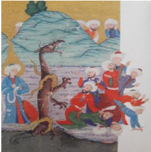
Resim 3 Ejderha'nın Nil'de yıkanacak olan Yusuf'u bakışlara karşı örtmesi, Yûsuf'u Züleyhâ CBL 428 (And, 2012, s. 428)