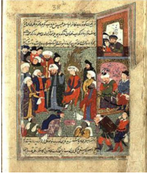
✓ Hz. Yusuf ile Züleyha'nın Karşılaşması Konulu Minyatür