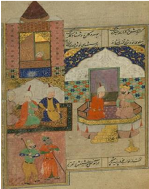
Resim 7 Yusuf, Mısır Kralının rüyasını açıklar, Heft Evreng, Walters Sanat Müzesi Bayan W.808, fol. 124a (Http-5)