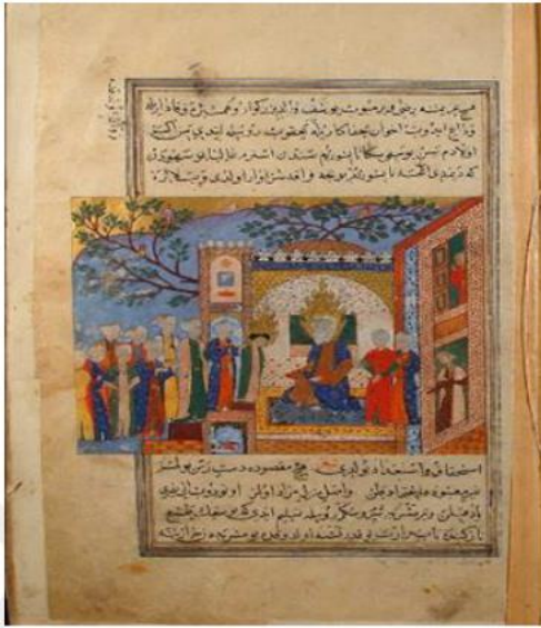
Resim 1 Hz. Yakup’un Oğlu Hz. Yusuf’tan Ayrılması, Hadikatü’s-Süedâ, 1586, KMM, 93, 20a (Turan, 2015, s. 262).

Yazılı kaynaklarda ele alınan Yusuf peygamber kıssasında, Hz. Yusuf’un gördüğü rüya sonucunda kardeşleri tarafından çöle götürülüp kuyuya atıldığından bahsedilir (Ateş, 1995, s. 1323). Buraya aldığımız (Resim 1) Hadikatü’s-Süedâ, (KMM, 93, 20a) minyatüründe görüldüğü üzere Yusuf peygamberin babasından ayrıldığı sahne ele alınır. Resim alınının merkezinde başında bir hale ile turuncu, mavi elbiseleriyle Yakup peygamber resmedilmiştir. İşlemeli bir minder üzerinde oturur bir vaziyette olan Yakup peygamberin sağ tarafında iki, sol tarafında ise on oğlunun olduğu görülür. On kardeşin en önünde yeşil bir elbise ve başının etrafında bulunan halesiyle Yusuf peygamber vardır. Olayın iç ve dış mekânda cereyan ettiği gözlemlenir. İç mekânda farklı işlemlerin yoğun olduğu, dış mekândaysa fonun tamamına yayılan bir ağaç motifi görülür. Fonun sağ tarafında altlı üstlü iki pencere mevcuttur. Bu pencerelerden hadiseyi izleyen iki kadın figürü görülür. Diğer figürlerde Hz. Yakup’a doğru bakmaktadırlar. Doğanın renklendirilmesinde açık mavi renk kullanılmıştır. Gökyüzü altınla boyanarak tamamlanmıştır. Figürlerde ise mavi, sarı, turuncu ve yeşilin tonları kullanılmıştır.