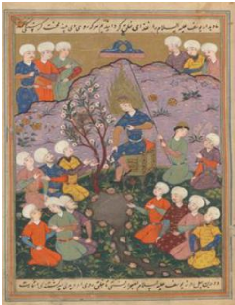
Resim 8 Mısır valisi olan Yusuf, küçük bir tahta oturuyor, Kısas'ı-Enbiya New York Halk Kütüphanesi, Spencer Coll. Pers. MS. 46, (Http-6)